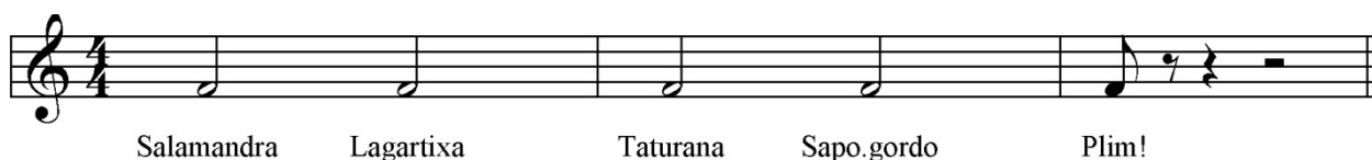
Fig. 3 – Estratégia de ensino da segunda voz aos participantes do estudo.

Após apenas observar as execuções musicais, os participantes foram convidados a aprender a tocar a “receita” da segunda voz. Essa “receita”, ou melodia, foi apresentada de forma lúdica e o ritmo a ser aprendido foi associado a palavras. De acordo com Caregnato (2012), o estabelecimento de relações entre ritmos e palavras facilita a aprendizagem. As crianças foram instruídas a tocar o xilofone falando as palavras “salamandra, lagartixa, taturana, sapo-gordo” e “plim”. A cada palavra correspondia um toque sobre a tecla do instrumento. As palavras eram pronunciadas de acordo com a duração da semínima ou da colcheia. A figura abaixo esquematiza o modo como a segunda voz foi tocada pelas crianças: