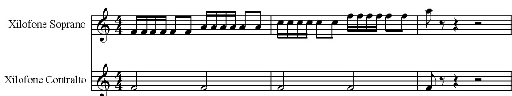
Fig. 2 – Música tocada pelos participantes e experimentadores.

As crianças foram informadas, de modo lúdico, que cada um dos experimentadores à sua frente possuía sua “receita” própria para fazer música, ou seja, que cada um dos músicos tocaria seu instrumento de uma maneira diferente. Após esse esclarecimento, cada um dos experimentadores demonstrou, em separado, um breve trecho de sua “receita” (ou melodia) para a criança. Por fim, as duas melodias foram executadas em simultaneidade (sem que essa simultaneidade fosse ressaltada verbalmente). A música utilizada no experimento é apresentada na figura abaixo: