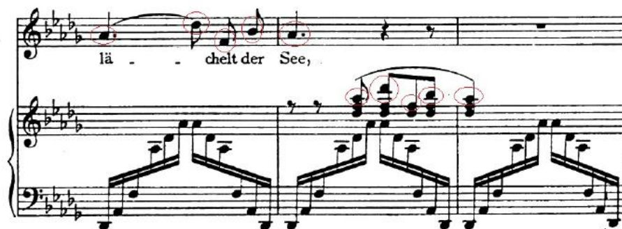
FIGURA 7 – Der Fischerknabe , de Franz Liszt, compassos 22 ao 24

Tal célula, porém, é a transformação do motivo Es lächelt der See ( Ao pescador o lago sorri ), já reutilizado de forma variada em diversos outros momentos: ao ser entoada pelo cantor nos compassos 21 e 23 (Figura 7), o piano imita este mesmo desenho e notas, e, o mesmo há de acontecer com a frase seguinte; er ladet zum Bade ( convidando para um banho ), compassos 26 e 27, na linha do canto, o instrumento toca as mesmas notas do compasso 27 e 28 (Figura 8);