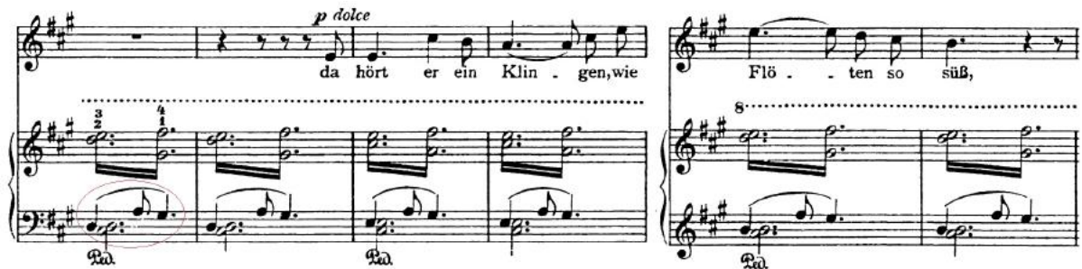
FIGURA 6 – Der Fischerknabe , de Franz Liszt, compassos 34 ao 39

que remete a uma espécie de canto repetitivo, que poderia ser atribuído a pássaros silvestres 14 , contribuindo ainda mais para este cenário de encantamento: