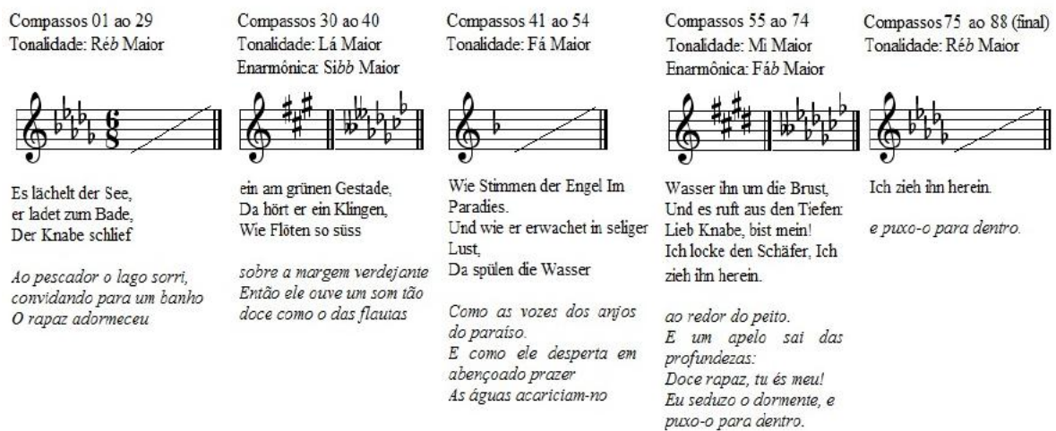
FIGURA 18 – Der Fischerknabe , de Franz Liszt, esquema dos compassos, mudanças de tonalidades e o texto presente em cada seção

Segundo a citação anterior, as relações que Liszt estabelece entre as tonalidades em Der Fischerknabe podem não ter sido planejadas a serviço da ilustração do texto, para corresponder a claras situações dramáticas; elas colaborariam somente para criar momentos contrastantes de instabilidade, ambiguidade, dubiedade, fruto de um estilo harmônico volúvel. Vejamos na figura a seguir relação entre o texto e as tonalidades: