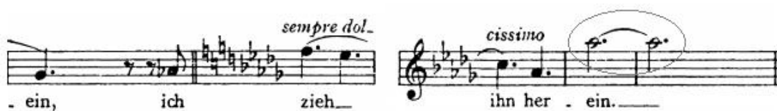
FIGURA 25 – Der Fischerknabe , de Franz Liszt, compassos 74 ao 78 - linha vocal; nota culminante

Liszt coloca a última frase já na nova tonalidade de Ré b Maior – representante esta do cenário idílico, agora retornando a seu estado anterior – porém, transformada pela ausência do jovem pescador. Ao inserir um salto de oitava ascendente, com longa sustentação na dominante de Ré b Maior, Liszt nos transfere novamente à linha do canto anterior – em que a melodia deste ser mitológico centrava-se em iniciar e terminar na nota Sol# (enarmônica de Lá b , Figura 25) no momento em que produzia palavras possessivas como mein (meu) e Ich zieh ihn herein (puxo-o para dentro) – como, mais curiosamente interessante, a nota culminante de toda a obra encontra-se nas palavras da sereia: