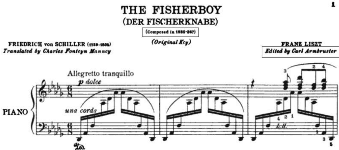
FIGURA 1 – Der Fischerknabe , de Franz Liszt, editada por Carl Armbruster; página 1

Armbruster (1975), presente no livro Thirty Songs for High Voice by Franz Liszt 9 , foi encontrada a afirmação “Composta entre 1835 e 36?”, conforme pode ser conferido abaixo: