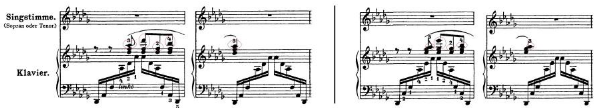
FIGURA 5 – Der Fischerknabe , de Franz Liszt, compassos 3 e 4; 7 e 8, respectivamente

Liszt utiliza tal abordagem com muita naturalidade, o que também contribui para o caráter fluido da peça. A melodia entoada pelo cantor neste ponto (Figura 4) – Es lächelt der See ( Ao pescador o lago sorri ) corresponde a um motivo que já teria sido introduzido anteriormente, nos compassos 3-4 e 7-8: