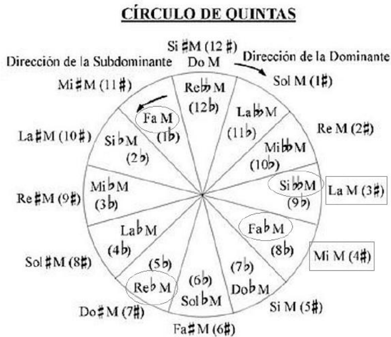
FIGURA 12 – Círculo das quintas – Destacadas as tonalidades presentes em Der Fischerknabe

Neste trecho acima já temos um exemplo de um dos recursos expressivos que o compositor emprega ao longo da canção - a matização 15 dos timbres do instrumento através dos contrastes entre as tonalidades: Liszt realiza uma travessia 16 entre as tonalidades de Réb Maior, Lá Maior, Fá Maior e Mi Maior, afastadas no círculo das quintas (Figura 12), porém, mantendo entre si Relações Mediânticas (Figura 13).