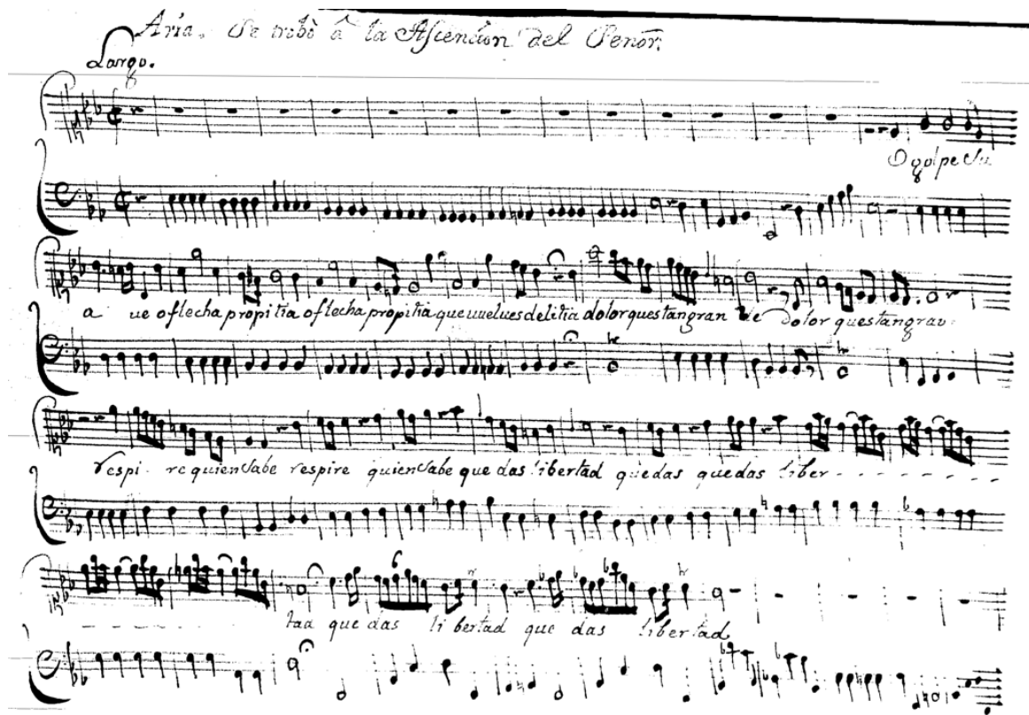
Fig. 2 – Recto de la primera hoja de la partichela del bajo continuo, con el texto de la línea-guía “O golpe suave”.

De acuerdo a la clasificación de Giuseppe Tavani, la obra O bien amable es un caso de contrafactum de tercer grado por poseer dos textos y evidenciar un proceso de resemantización efectuado en una composición donde la música adquiere una doble carga significativa a través de las palabras utilizadas en los textos que la acompañan, uno devocional ( O bien amable ) y uno profano ( O golpe suave ). 15 Ahora bien: