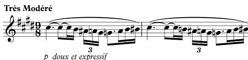
Fig. 3 - Parte 1a do solo de flauta do Prélude à l'après-midi d'un faune de Claude Debussy, compassos 1 e 2.

A melodia é composta por uma ondulação cromática apresentada pelo solo de flauta e é dividido em duas partes distintas. A primeira, que denominamos de 1a, tem como notas estruturais o intervalo de quarta aumentada/quinta diminuta, isto é, o trítono (Dó #5 -Sol 4 ) em torno do qual se desenvolve os dois primeiros incisos, ilustrado na Figura 3 abaixo: