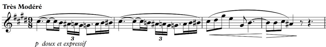
Fig. 2 - Excerto do solo de flauta do Prélude à l'après-midi d'un faune de Claude Debussy, compassos 1 a 4.

O tema do fauno representado pelo excerto orquestral para flauta composto pelos quatro primeiros compassos do Prélude à l'après-midi d'un faune de Debussy encontra-se na Figura 2 a seguir: