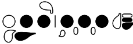
Fig. 10 - Diagrama de dedilhado alternativo para o Dó#5 chaves de polegar, 2 e 3 na mão esquerda; 1, 2, 3 e Dó na mão direita.