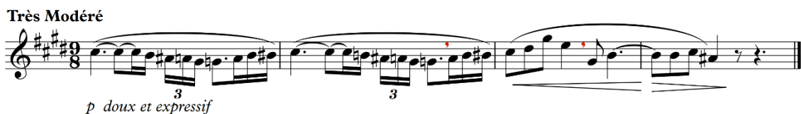
Fig. 6 - Excerto do solo de flauta do Prélude à l'après-midi d'un faune de Claude Debussy, compassos 1 a 4, com as anotações de respiração sugeridas por Jeanne Baxtresser em vermelho.

As sugestões de Baxtresser (2008) estão ilustradas na Figura 6 a seguir: