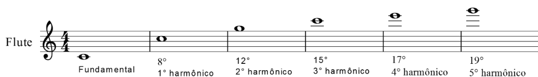
Fig. 9 - Série harmônica da nota D 4 (fundamental) da flauta, D 5 (1° harmônico), Sol 5 (2° harmônico), D 6 (3° harmônico), Mi 6 (4° harmônico) e Sol 6 (5° harmônico), respectivamente.

A respeito da base acústica da flauta, Toff (2012, p.93) comentou que “a qualidade do som é determinada pela presença e força relativa dessas parciais. Em geral, quanto maior o conteúdo harmônico, mais rico e maior a sua projeção”. Fletcher (1974) explicou detalhadamente o processo de como ocorre a influência dos harmônicos no timbre da flauta: