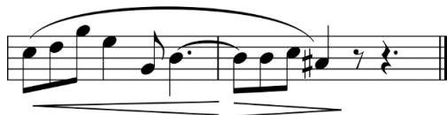
Fig. 4 - Parte 1b do solo de flauta do Prélude à l'après-midi d'un faune de Claude Debussy, compassos 3 e 4.

A segunda parte desta melodia inicial, que denominamos 1b, organiza-se em torno do modo Dórico, mas com a ausência do Fá # 5, apresentado na Figura 4 a seguir: