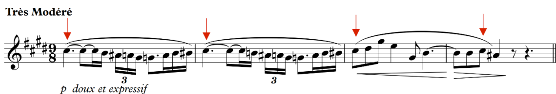
Fig. 7 - Excerto do solo de flauta do Prélude à l'après-midi d'un faune de Claude Debussy, compassos 1 a 4, com flechas apontando para o Dó #5 recorrente.

Toff (2012, p.101) mencionou que “a flauta não é um modelo de acústica perfeita; algumas soluções alternativas inerentes à sua construção impedem-na de ter uma afinação absolutamente precisa”. A autora explicou que “no registro médio, o Dó #5 tende de ser alto ” e no caso do Prélude à l'après-midi d'un faune , é exatamente com essa nota que o compositor inicia o solo de flauta. Como tratado anteriormente, o Dó #5 aparece quatro vezes neste trecho, sendo duas vezes como um dos polos de estabilidade da melodia, como podemos verificar na Figura 7 abaixo: