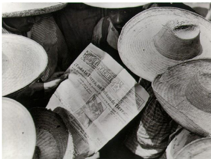
Fotografia 5 – Camponeses lendo El Machete – Tina Modotti, 1928. Disponível em: http://www.unilat.org/VirtualeMuseum/Datas/oeuvreContemporaine.asp?l=Pt&e=modotti&e2=&o=289 . Acesso em 29/02/2016.

Nessa fotografia, um grupo de camponeses tem em mãos o El Machete 8 , jornal oficial do Partido Comunista. Na manchete principal do jornal, lê-se “Toda la tierra, no Pedazos de Tierra!” numa clara alusão a luta pela reforma agrária, um dos principais motivos da luta camponesa desde antes da eclosão da Revolução de 1910.