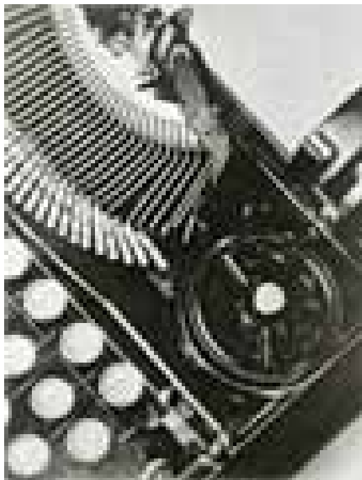
Fotografia 6 - Máquina de escrever de Mella – Tina Modotti, 1928. Disponível em: http://www.unilat.org/VirtualeMuseum/Datas/oeuvreContemporaine.asp?l=Pt&e=modotti&e2=&o=279 .

Nessa concepção, considerada uma fotografia singular no período, tem-se Máquina de escrever de Mella , de 1928, que é totalmente simbólica.