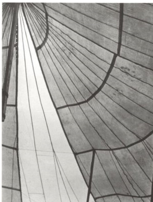
Fotografia 2 – Tenda de Circo – Edward Weston, 1924. Disponível em: https://www.pinterest.com/explore/edward-weston/ . Acesso em 29/02/2016

Outra fotografia em que se pode perceber o destaque do aspecto formal intitula-se Flor de Manita , de 1925. Nessa fotografia, a escultura de uma flor de formato bastante diferenciado define o enquadramento da imagem, em que o ângulo escolhido foi o frontal. A iluminação destaca a parte superior da escultura, que tem certa semelhança com uma mão. Essa característica também é bastante significativa se pensarmos nas fotografias de Tina dos murais dos prédios públicos mexicanos, em que, sempre que possível, ela destacou a presença das mãos. 5 Nota-se, portanto, uma permanência estética na fotografia de Tina, assim como uma ligação simbólica: a representação direta ou indireta de algo que remeta às mãos.