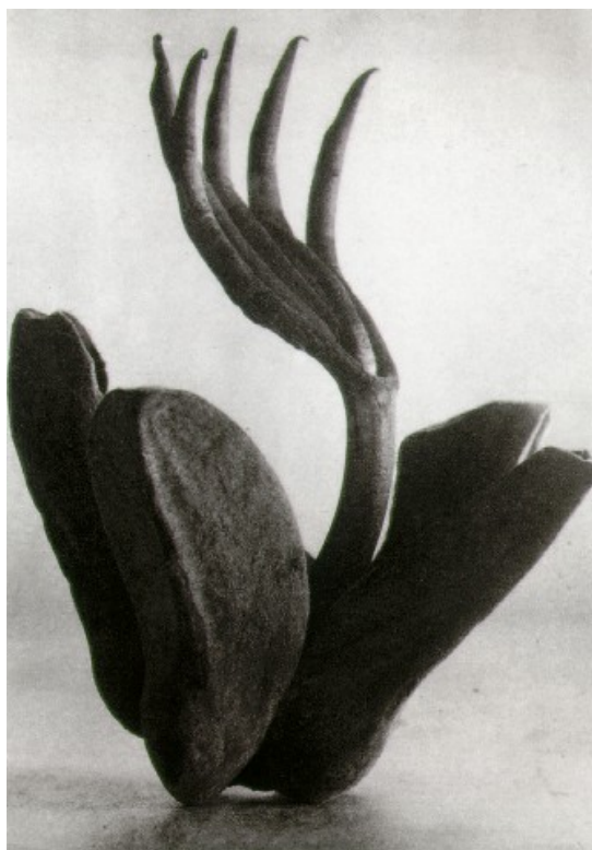
Fotografia 3 – Flor de Manita , Tina Modotti, 1925. Disponível em: https://pendientedemigracion.ucm.es/info/especulo/numero36/tinisima.html . Acesso em 29/02/2016

Já mais próximas ao aspecto semântico proposto por Freitas (2004), as fotografias de Tina produzidas para o livro Ídolos tras los altares (1983), mantiveram essas características formais, desdobrando-as em outros enfoques. O livro foi o resultado final do projeto, mencionado anteriormente, em que Tina, acompanhada de Weston e Anita Brenner 6 , viajaram por aproximadamente quatro meses pelo interior mexicano. Esse projeto teve início com um acordo feito entre Anita e a Universidade Nacional Autónoma Mexicana - Unam - que visava retratar a arte folclórica e religiosa mexicana. Brenner convidou Tina e Weston para produzirem as fotografias que integrariam o projeto. Após a viagem, as fotografias produzidas, junto a pesquisas de Anita resultaram no livro.