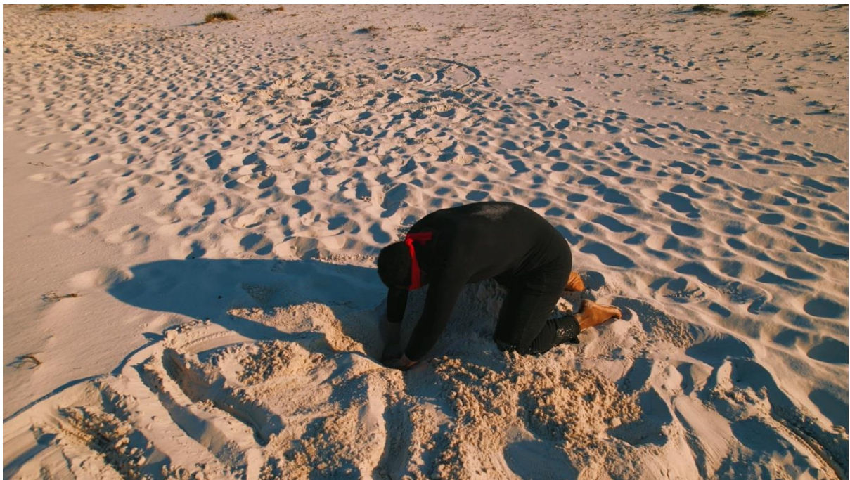
Figura 2, Augusto Henrique Lopes Costa, Imagem Digital de PaR. 2023