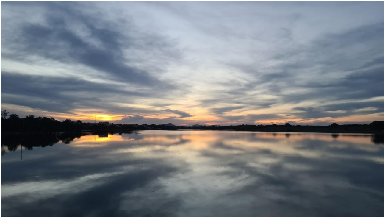
Título: Açude Grande. Centro da cidade de Cajazeiras na Paraíba, 2018. Autor: Stallone Abrantes

Descrição da Imagem. #Paratodosverem: Acima muitas nuvens cobrem o céu e refletem todas elas nas águas abaixo da imagem. No centro da imagem um sol se pondo ao fundo e muitas serras no horizonte compondo a paisagem.