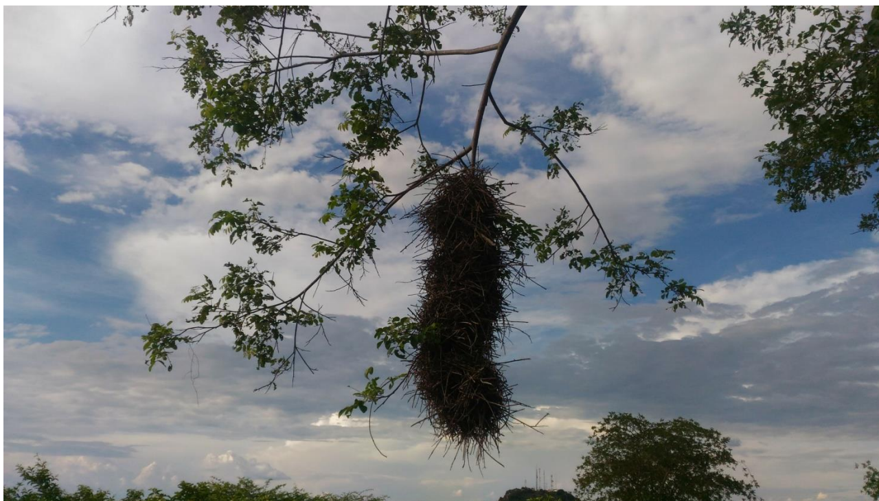
Título: Ninho azulado, Sítio Serra da Arara em Cajazeiras na Paraíba, 2017.

Descrição da Imagem. #Paratodosverem: Ao centro da imagem um galho de uma árvore com um ninho caído em formato retangular. Ao fundo se percebe um céu azul com nuvens brancas. Abaixo da imagem se observa algumas plantas e árvores.