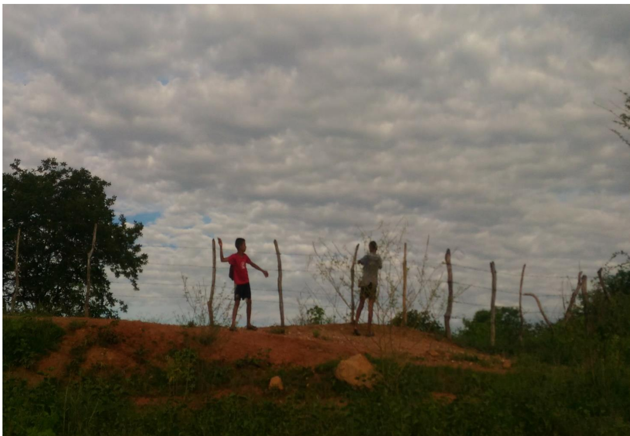
Título: Caçando passarinhos na beira do açude. Área rural de Cajazeiras na Paraíba, 2017. Autor: Stallone Abrantes

Descrição da Imagem. #Paratodosverem: Ao centro da imagem pode ser observado duas crianças, uma com braço direito levantado vestindo uma bermuda preta e uma blusa vermelha, a outra veste uma camisa cinza e uma bermuda, esta última pendura uma gaiola de passarinho numa cerca de estacas. Ao fundo da foto muitas nuvens no céu. Na parte de baixo da fotografia há um gramado ralo e um arbusto na parte direita e algumas pedras, a terra é de cor barroza, ao lado esquerdo há uma árvore com folhas verdes.