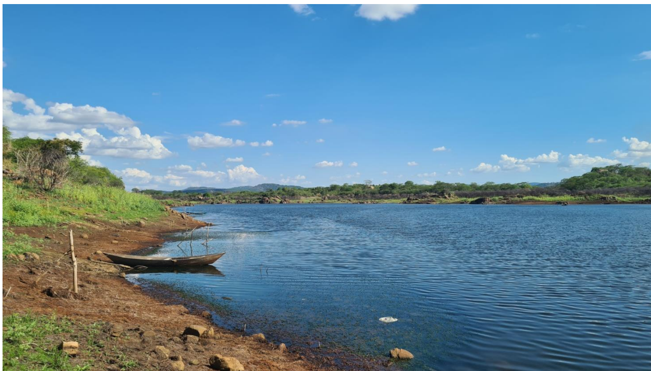
Título: Águas de São Gonçalo. Açude de São Gonçalo na Paraíba, 2022. Autor: Stallone Abrantes

Descrição da Imagem. #Paratodosverem: Ao lado direito da imagem, vê-se as águas azuis do açude e alguns campos com uma pequena elevação, uma pequena serra coberta de árvores. Acima um céu azul claro com nuvens brancas. Ao lado esquerdo uma pequena canoa atracada e terras com uma cor marrom forte seguido de uma estaca de madeira no meio e algumas plantas.