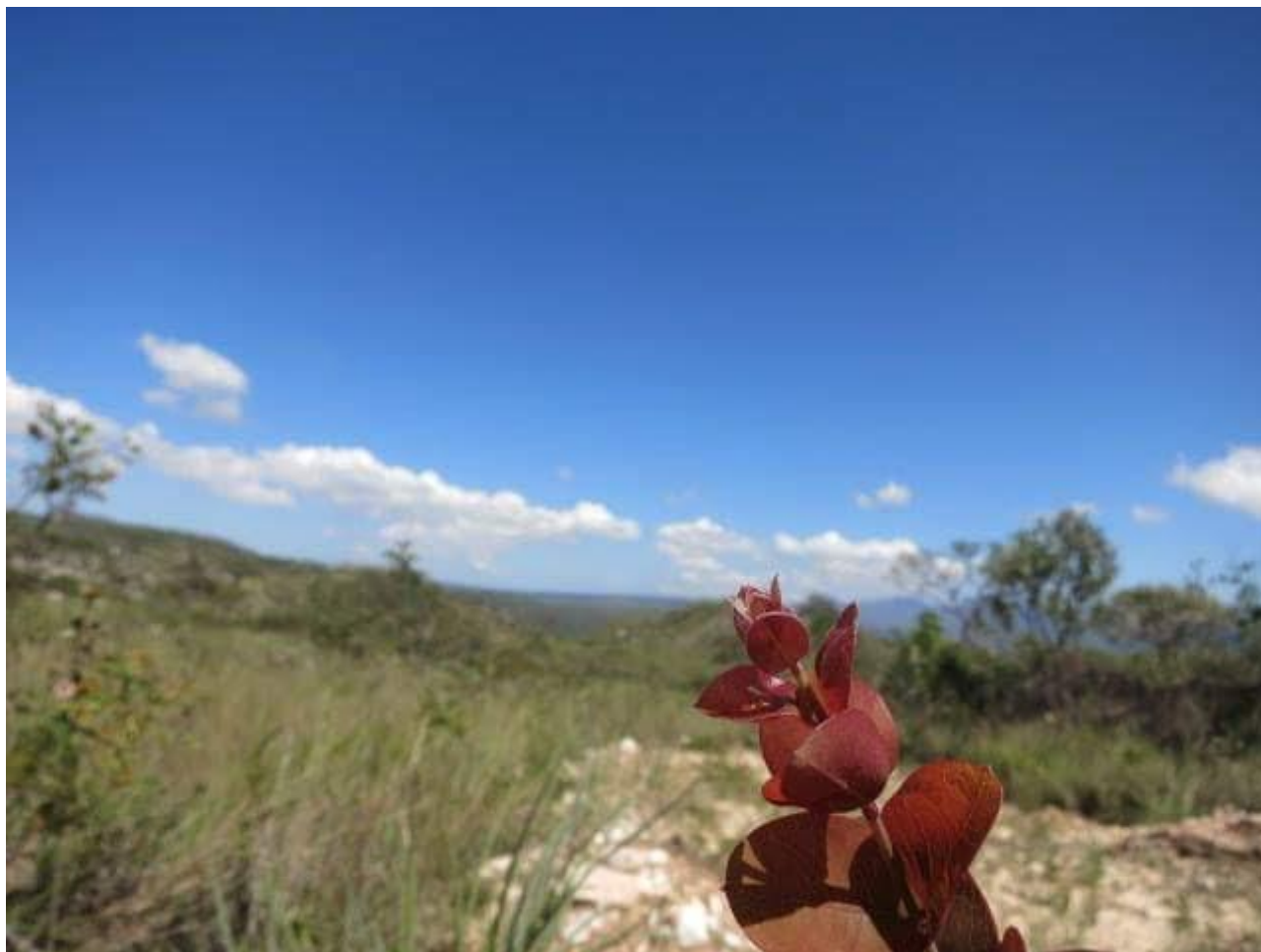
Título: Flor do sertão. Bairro de Capoeiras-Cajazeiras-PB, 2016. Autor: Stallone Abrantes

Descrição da Imagem. #Paratodosverem: Ao centro da imagem uma flor cor de vinho, tendo 13 pétalas. Ao fundo desfocado se percebe capins e pequenas árvores compondo a paisagem e bem ao fundo um céu azul com nuvens desfocadas.