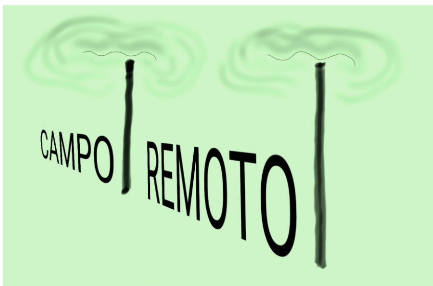
Fig.2: Carina Weidle. Estudo de nome para as atividades do Ensino Remoto Emergencial em 2020.