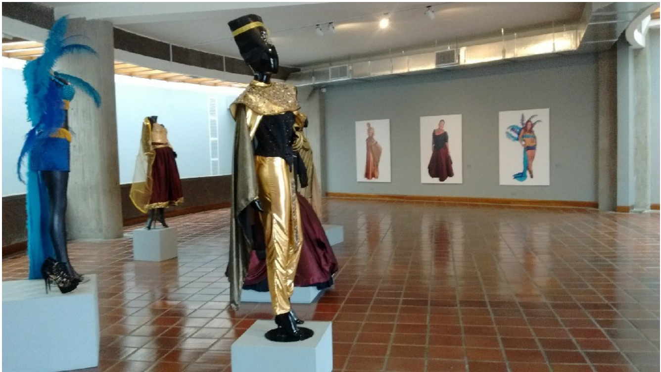
Imagen 4. Vestidos Orales (2014), de Sandra Silva. Exposición “Itinerarios del vértigo”, Museo de Arte de Pereira, Pereira.

En esta exposición destaca también un mapa visual de grandes dimensiones, dibujado sobre uno de los muros, a la entrada de la exposición. Está elaborado a base de formas geométricas y líneas unidas entre sí, que a su vez ordenan y relaciona una serie de palabras clave. En este mapa, podía leerse: “INVESTIGACIÓN BASADA EN LA CREACIÓN”; arriba, “ITINERARIOS DEL VÉRTIGO”; debajo, “A partir de LO RELACIONAL y LO CONTEXTUAL”; en los laterales, “ACONTECIMIENTOS ESTÉTICO-ARTÍSTICOS”, junto a “1.INSTALACIÓN VESTIDOS ORALES”, “2.CRÓNICA AUDIOVISUAL DÍAS DE AFRODITA” y “3.LIBRO DE PENSAMIENTO Y PRODUCCIÓN ESTÉTICO-ARTÍSTICO”; y, también en los laterales, “PROVOCACIONES ESTÉTICO ARTÍSTICAS, junto a “1.MAPA SIMBÓLICO DEL MIEDO”, “2.FOBÓFONO” y “3.REGISTRO AUDIOVISUAL VESTIDOS ORALES”.