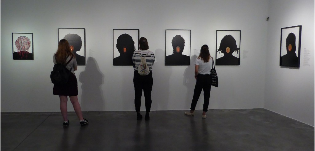
Imagen 1. Interior de la exposición Unsterile Clinic . 2016. Aida Silvestri. Galería Autograph ABP-Rivington Place, Londres.

(Londres, Reino Unido), del 8 de julio al 17 de septiembre de 2016. La muestra de la exposición y de las obras versaban sobre el tema de la Mutilación Genital Femenina (MGF, en adelante). Era resultado de un proyecto artístico que la artista había realizado sobre la MGF durante los años 2015 y 2016, y que estuvo subvencionado por el organismo del “Arts Council England”.