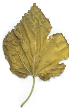
Imagen 6. Representación fotográfica del envés de una hoja. Imagen propia, 2020.

Con esta metáfora entre el envés de una hoja y la exposición de arte quisiera poner el foco sobre todo aquello que tradicionalmente quedaba en la sombra de la exposición de arte, que no está presente y no se incluye en las salas de exposición, pero que han configurado las obras y elementos que se exponen: la historia de vida de los/as autores/as (y no solo el currículum de méritos que la justifican); las referencias artísticas, teóricas, históricas y culturales que sus autores/as han considerado en el proceso de creación; las cuestiones técnicas y materiales del trabajo artístico realizado; las consideraciones vivenciales, subjetivas y teóricas que fueron dando lugar a la obra, y las decisiones que sus autores/as fueron tomando a lo largo del proceso. En definitiva, todo aquello que en un proyecto de investigación constituye el marco teórico, la metodología y los resultados.