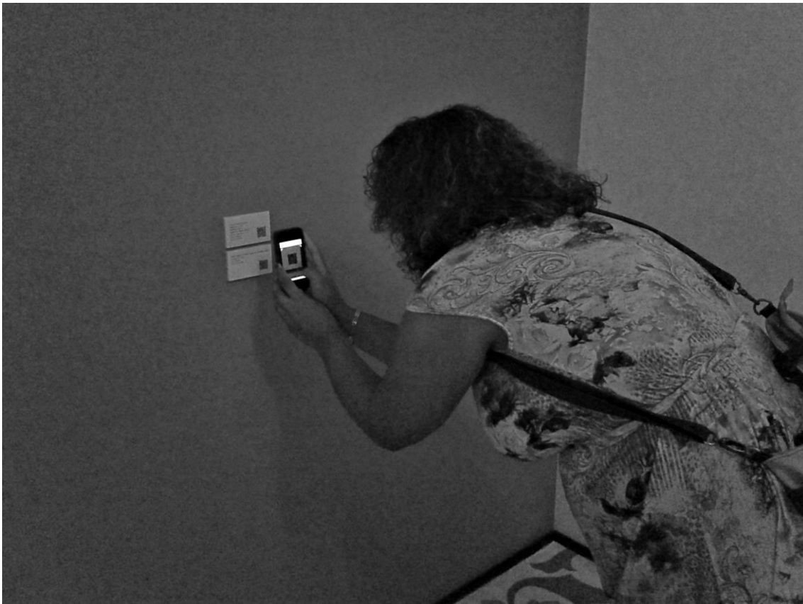
Figura 3. Exposição “ O Encantado ”, desenhos, pinturas e objetos de Attilio Colnago . Visitante escaneando com o celular pessoal o QR-code sobre uma das obras da mostra. 2014.

A presença cada vez maior dos dispositivos celulares tem nos permitido uma aproximação ao mundo digital/virtual, agora coabitante de nosso ambiente, e que antes se limitava unicamente à tela de nosso computador. Assim, a tela do nosso celular se torna, atualmente, em um ponto de acesso primordial do chamado homo ecranis (Lipovetsky e Serroy, 2009) que está presente em nosso cotidiano. É por isto que no âmbito artístico estes meios de mediação estética estão cada vez mais presentes, não apenas como um dos suportes da arte digital, mas também como um meio de difusão, de acesso e interação com obra de arte, para além da sua fisicalidade nos espaços expositivos.