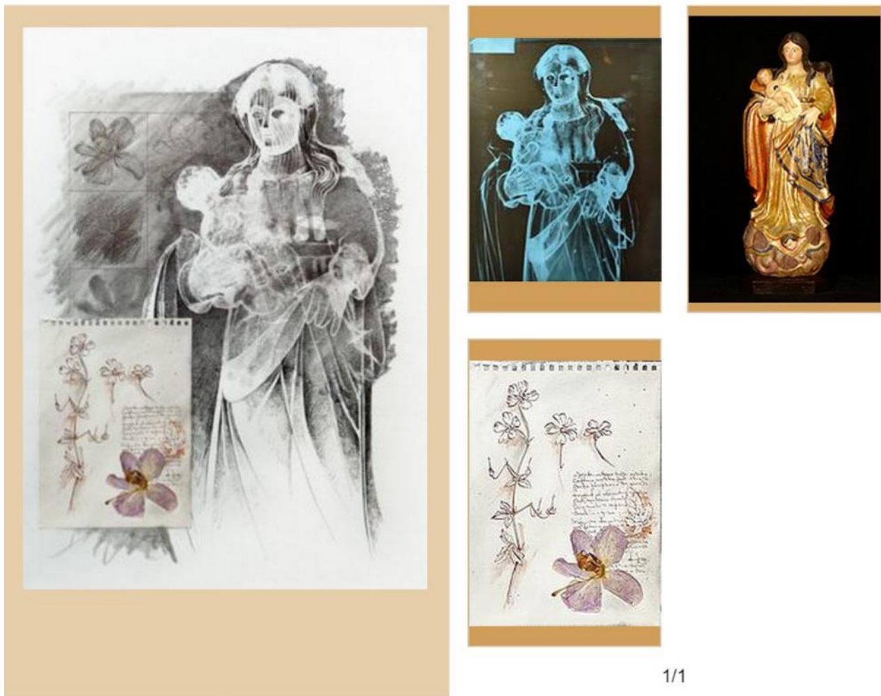
Figura 5. Conteúdos digitais do trabalho Madona com flores (2012). Aqui mostram-se diferentes documentos do processo criativo do artista como uma radiografia resultado do trabalho de restauração realizado pelo próprio artista da imagem religiosa de Nossa Senhora do Amparo da localidade capixaba de Itapemirim (ES-Brasil). Podemos perceber que os trabalhos do artista são uma visão híbrida de um conjunto de referências visuais como um detalhe dos desenhos de uma orquídea do artista Leonardo da Vinci e uma orquídea dissecada na folha de papel que se tornaram como parte importante do resultado final do trabalho. Captura de tela pelo autor.

Esta ideia de expandir os limites físicos do espaço expositivo, no qual encontramos a obra final, buscava tornar possível aumentar, por meio das novas tecnologias digitais, a experiência sensível do público, o que nos faz participantes do ideal de André Malraux, em seu texto O museu imaginário (1947), que, como precursor da ideia de um acervo em Rede, supõe a existência de um imenso cibermuseu no qual se reúnem todas as expressões da arte, todos os estilos, todos os artistas... em uma grande sala de exposição que tem como cenário a Internet e o meio digital. Estes conceitos colocados por Malraux poderiam ser extrapolados aos documentos que são parte do processo criativo do artista, pois, levam a uma nova compreensão da obra; os bosquejos, os rascunhos ou os ensaios, entre outros, nos permitem ter essa visão ampliada que conforma um contexto excepcional para entender a obra de arte a través do paradigma do meio digital.