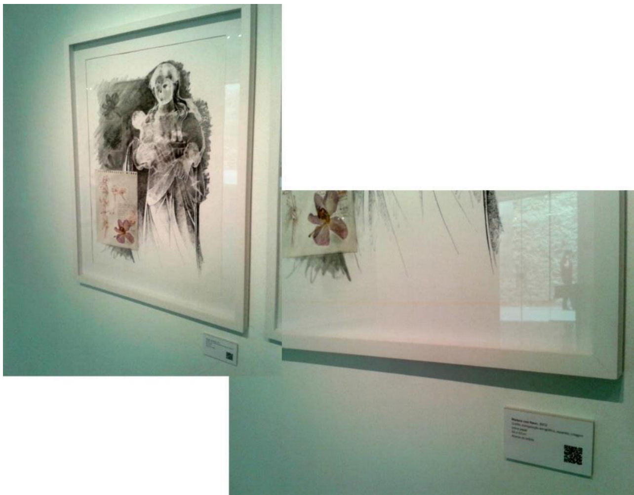
Figura 4. Atilio Colnago, Madona com flores (2012). Trabalho do artista na sala de exposição com etiqueta do QR-code para acessar os conteúdos digitais. Foto do autor. 2015.

uma visão ampliada a través do espaço digital. Os conteúdos que eram mostrados aos visitantes da mostra que acessavam aos QR-codes, foram hospedados em um site 2 que recolhia informações digitais com textos explicativos e com a documentação do processo criativo do artista. Deste modo, conseguíamos nos aproximar desses elementos da memória pessoal do artista e dos grandes mestres da pintura que inicialmente inspiraram as obras mediante a constituição de um (ciber)espaço expositivo que tornava o ato fruidor da obra da arte em um ato híbrido entre o espaço físico da mostra e seu prolongamento digital/virtual (Figuras 4 e 5).