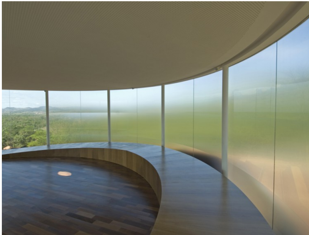
Imagem 5 - Doug Aitken, Sonic Pavilion , 2009.

Há ainda espaço para transformações? Posto que não se trata mais de provocar rupturas ou revoluções, a questão que se coloca é: na medida em que preciso escapar à neutralização do museu (Adorno), na medida em que nenhum modelo expositivo até hoje conseguiu respeitar completamente a autonomia da obra de arte, ou seja, não há maneiras de se preservar a autonomia (tanto no sentido moderno auto-referencial, quanto no sentido conceitual daquilo que definimos como obra artística), como operar enquanto artista propositor de trabalhos in situ , sem que já de antemão a institucionalização minimize sua potência de fala? Tornando rarefeita a experiência poética.