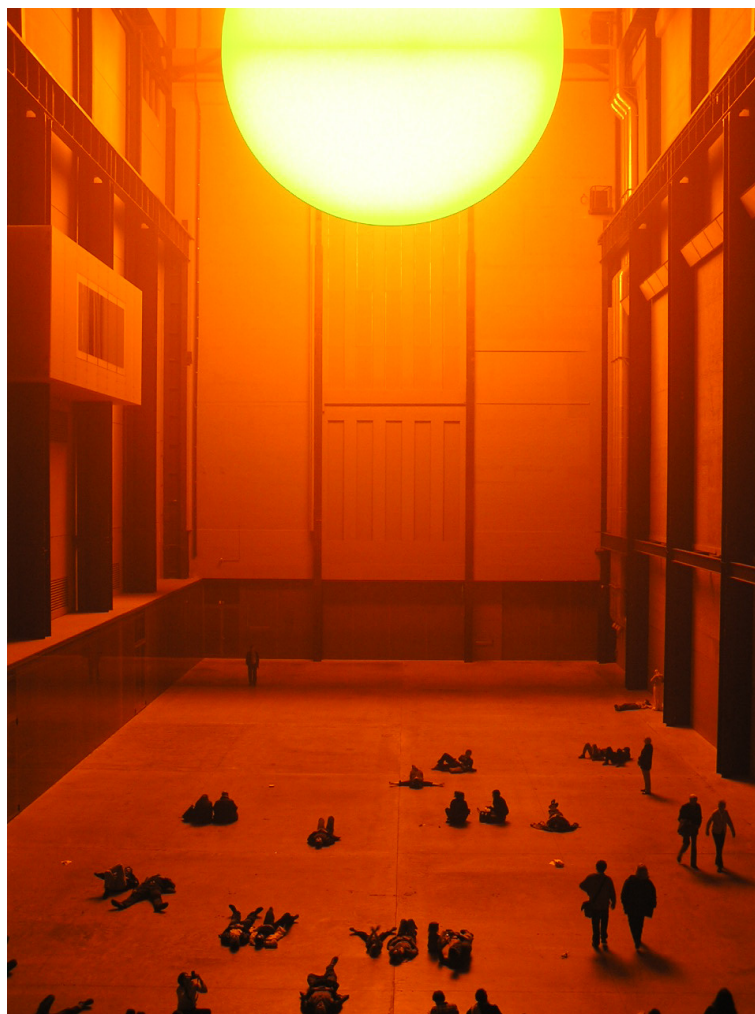
Imagem 6 – Olafur Eliasson, The Weather Project , 2003.