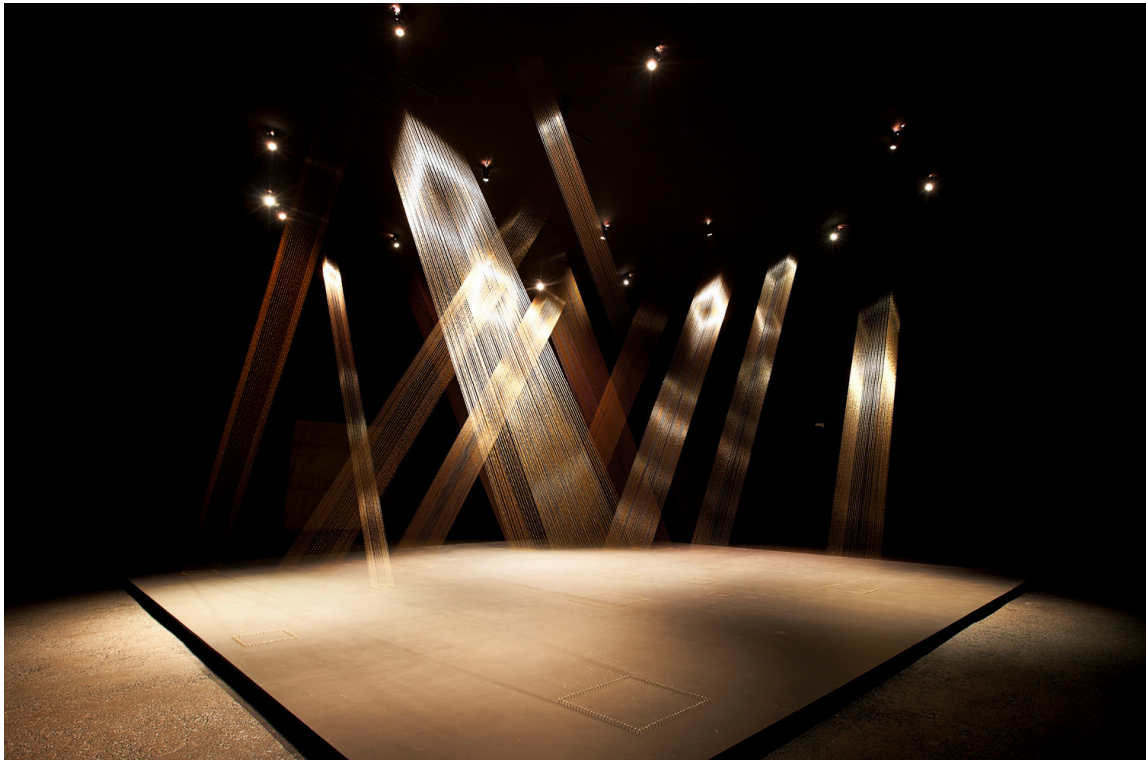
Imagem 3 – Lígia Pape, Tétia I-C , 2002. 13

No Cruzeiro do Sul , a estrutura se estende para um espaço indefinido, irresoluto, vago, ao mesmo tempo em que não está separada da fisicalidade que o circunda. Aqui perscrutamos dois exemplos uma análise formal que revelam ações de consequências políticas: Inhotim congela Tetéia , constrói um templo para ela, e a reverberação poética da obra se acabrunha frente a essa neutralização. Já o Cruzeiro do Sul é móvel, se espalha, se faz e se refaz a cada exposição, alarga seus limites, e não há como não encará-lo de maneira subversiva por colocar à sua disposição centenas de metros quadrados para abrigar milímetros quadrados de matéria.