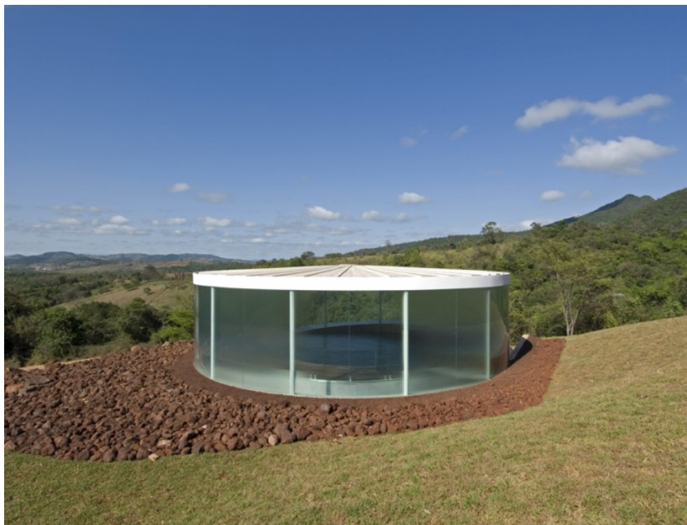
Imagem 4 - Doug Aitken, Sonic Pavilion , 2009.

arquitetura que abriga estes trabalhos. E portanto a diferença reside mais no trabalho de arte em si, já que Tetéia é uma instalação que se propõem independente do seu continente, e no Sonic Pavilion , aquele pedaço do mundo é seu continente e conteúdo. Porém, assim como Cruzeiro do Sul , Tetéia também requisita o espaço institucional do entorno, a diferença reside na autonomia desta enquanto imagem total, o que não acontece com Cruzeiro do Sul que é frágil neste sentido.