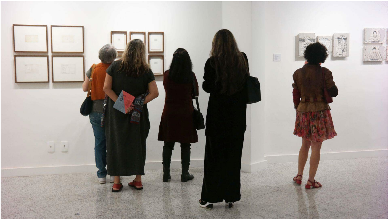
(Fig. 3: Público durante a abertura da mostra Novísimos )

O primor técnico, no entanto, não tem um cunho gratuitamente preciosista. Como afirmou Cesar Kiraly, curador da galeria: “os níveis da prostituição são mostrados com glamour, por todos os lados, em plena função de fazer ver a sua crueldade não vista” 2 . Kiraly pontua que a representação realista consegue burlar os modos do “anestesiamento moral”. A artista assume, dessa forma, uma preocupação ética de afetar o interator da obra, dando visibilidade e audibilidade ao que costuma ser ignorado pela sociedade.