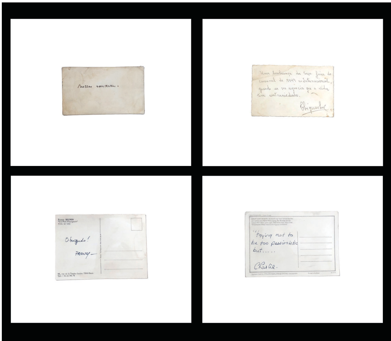
(Fig. 4: Renata Nassur. Verso (2018). Aquarela 63x74cm políptico)

O próprio vocábulo prostituição tem uma conotação que evoca um lugar público. O termo deriva do latim prosto , que significa estar as vistas, à espera de quem quer chegar ou estar exposto ao olhar público e possui outras designações como mulher de vida fácil e garota de programa. A prostituta é a mulher que aluga seu corpo para jogos sexuais sem amor e a sua imagem tem sido ligada à imoralidade e a um espaço de satisfação dos desejos sexuais masculinos (BATISTA, 2015).