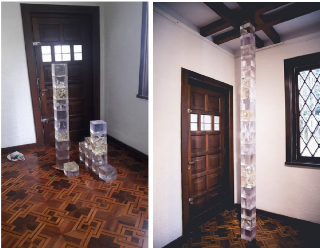
Figura 6: Montagem da primeira parte do Prisma.

A montagem da primeira parte do Prisma (Figura 6) foi feita com sobreposições de cada unidade, nivelados com fitas adesivas transparentes de silicone. Esse material adesivo seguraria a coluna até o teto, onde a pressão entre chão e teto trouxe estabilidade à coluna. No outro canto, para atender à curiosidade do toque e da experimentação, bem como retomando a ideia de se ver em todas as diversas faces do cubo, quatro dos 24 cubos foram disponibilizados, à princípio no chão, mas posteriormente sobre um pedestal disponibilizado pelo próprio MGTV. Esses quatro cubos à interação do público durante a exposição veio acompanhado de aviso permitindo o manuseio. Dessa forma, o trabalho final passou a ocupar toda a extensão frontal da sala de exposição do MGTV.