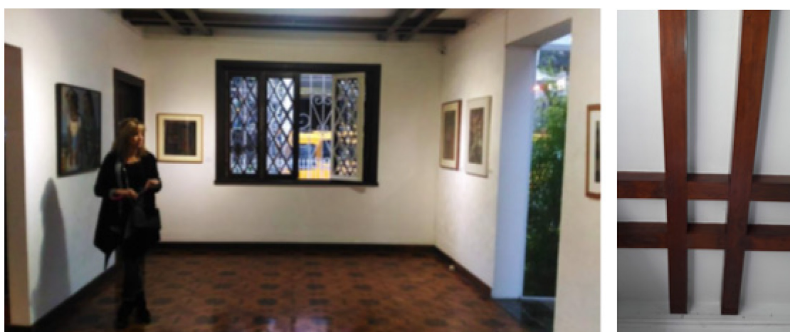
Figura 5: Espaço expositivo do MGV com detalhe das vigas no teto.