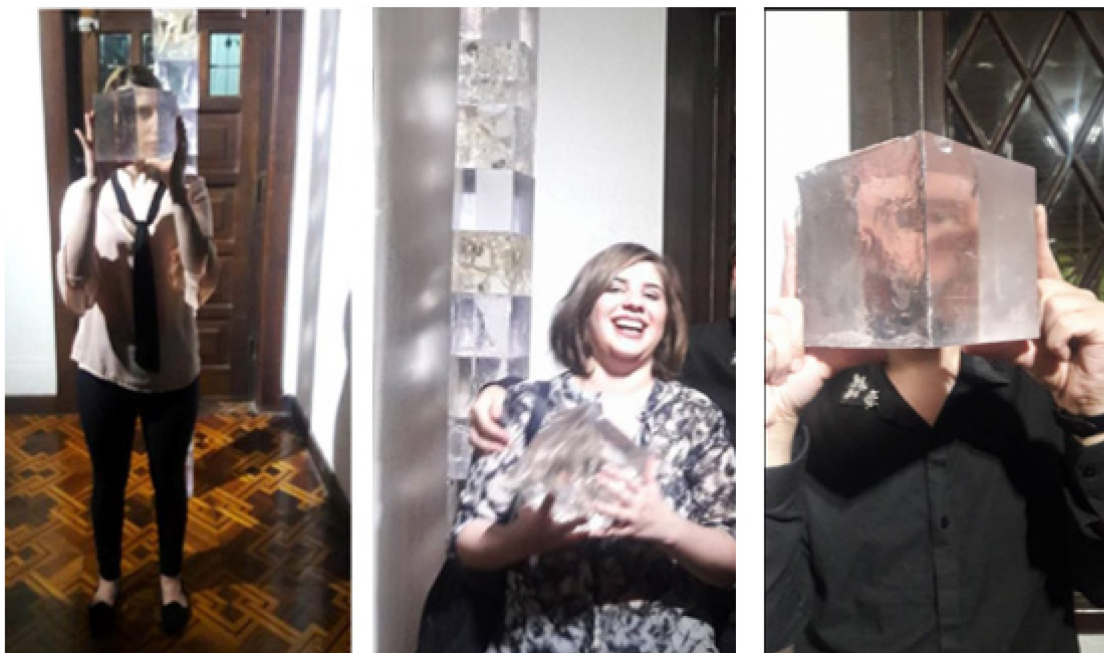
Figura 8: Interação do público.

Mais uma vez o público me trazia a experiência que eu não tive com meu próprio trabalho. Essa troca foi importante para que, além da transparência e todos os outros elementos visuais e características do material, eu pudesse ter um novo olhar sobre o Prisma que passei tantos meses pensando, refletindo e produzindo e que, provavelmente nunca alcançaria sozinho. Para o grande público o trabalho foi absorvido como algo frágil, trincado por batidas e não por um processo químico.