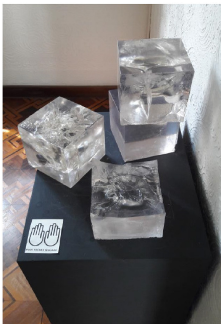
Figura 7: Parte direita do Prisma .

Em relação à interação do público (Figura 8), após observar a coluna de cubos à esquerda, as pessoas se dirigiam aos cubos sobre o pedestal e começavam sua interação, sentindo o peso, observando o espaço por ele e registrando em fotografias suas experiências. Quase que como seguindo um manual de instruções, as pessoas elevavam o cubo ao campo da visão e passavam a observar o ambiente (figura 8). Por diversas vezes eu retornava ao trabalho e encontrava alguém tentando enxergar através dos cubos os mais variados ângulos e situações ao longo da noite de abertura. Além disso, como uma peça de montagem ou quebra-cabeças, o Prisma instigava perguntas frequentes: “Como você conseguiu montar um em cima do outro, eles são irregulares?; É de vidro?; Posso tocar?; Se cair quebra?; Como você desenhou dentro?; Por que uns são mais rosados e outros amarelado?; Nossa que pesado!”. Essa resposta do público ao trabalho me fez pensar mais sobre alguns elementos e a perceber outros que ainda não tinha consciência.