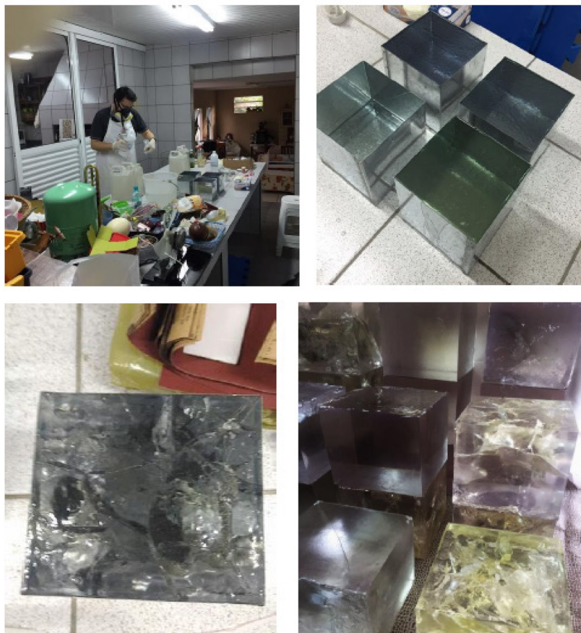
Figura 3: Registro do processo de experimentações em cubos de resina.

Essa possibilidade me fez pensar sobre o objeto único, mesmo que advindos da mesma fôrma em alumínio. Cada rachadura, parte lascada, bolhas e desníveis davam personalidade aos cubos. Nesse caso a transparência também se mostrava importante por expor pontos de vista importantes aos planos do cubo.