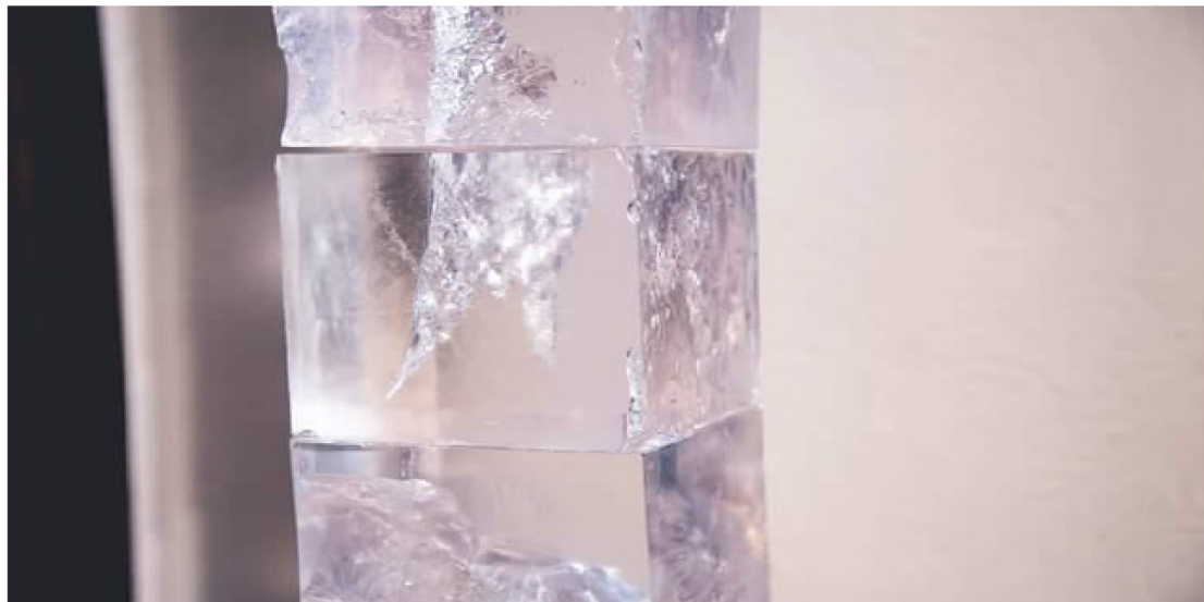
Figura 9: Detalhe da coluna do Prisma.

meu processo de criação e experimentações. Dessa forma, a contribuição do público contribui significativamente para as minhas reflexões poéticas futuras.