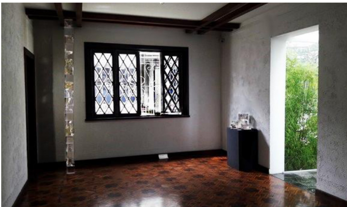
Figura 1: Prisma, 2016. Fonte: o autor, 2016.

Utilizando a resina acrílica cristal, pude construir cubos moldados em fôrmas de alumínio de quinze centímetros e, posteriormente, os reuni no espaço expositivo do MGV como um trabalho que passou a explorar alguns conceitos já tratados na Arte do século XX, como da arquitetura e não-arquitetura, por Rosalind Krauss (1984) ou da repetição por Gilles Deleuze (2000). Esses conceitos, somados às referências pessoais de trabalhos e outros artistas, bem como do próprio processo poético, resultou no Prisma como dois conjuntos de experiências: uma escultura de canto, específica e montada para o ambiente; e os cubos disponíveis para interação com o público no outro nicho do espaço.