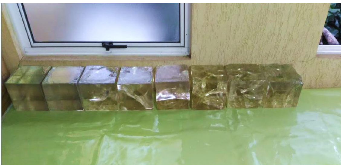
Figura 4: Organização dos cubos em produção no ateliê.

Essa possibilidade me fez pensar sobre o objeto único, mesmo que advindos da mesma fôrma em alumínio. Cada rachadura, parte lascada, bolhas e desníveis davam personalidade aos cubos. Nesse caso a transparência também se mostrava importante por expor pontos de vista importantes aos planos do cubo.