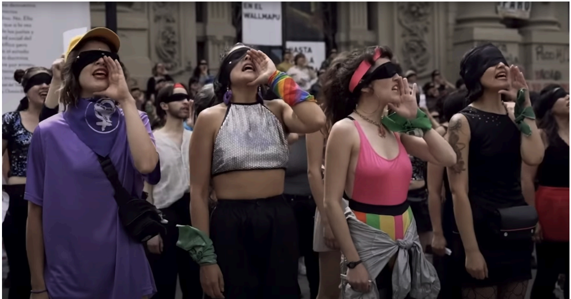
Figura 5: Un violador en tu camino , 2019. Plaza Sotomayor, Valparaíso, Chile. Frame de “LASTESIS. Plaza Sotomayor 29.11.2019. VALPARAÍSO, CHILE” – YouTube. 22

La cuestión se intensifica en el momento en que la canción da paso a la parodia del “Himno de los Carabineros”, que contempla un cambio gestual en la actuación, cuando el discurso se dirige a la “niña inocente”. Las manos, que antes señalaban al violador, ahora se colocan cerca de la boca, como quien cuenta un secreto.