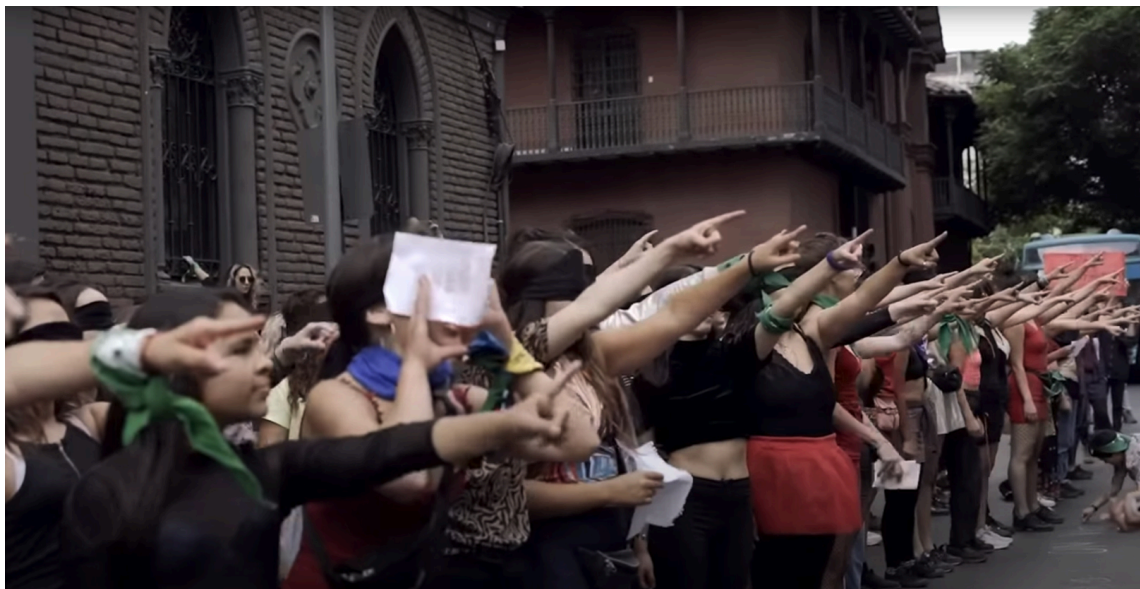
Figura 4: Un violador en tu camino , 2019. Plaza Sotomayor, Valparaíso, Chile. Frame de “LASTESIS. Plaza Sotomayor 29.11.2019. VALPARAÍSO, CHILE” – YouTube. 21

2) Aguda, intensa y perspicaz: transforma la teoría feminista (por ejemplo, Rita Segato) en activismo callejero encarnado y desobediente. Lo personal y lo social son políticos y se explicitan en el verso “El estado opresor es un macho violador”, al nombrar al Estado, al presidente, a los carabineros y a los jueces como machos violadores, tanto en el pasado como en el presente (eras/es). En ese momento, se señala el Cuartel General de la Armada de Chile, símbolo de las fuerzas armadas y de la represión estatal, y los monumentos históricos relacionados con la guerra y el nacionalismo, en el caso de la actuación en la Plaza Sotomayor, en Valparaíso, Chile.