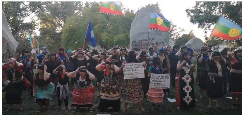
Figura 6: Un violador en tu camino en Berlín, Alemania; Salvador, Brasil; Nueva Delhi, India; Mujeres Mapuche, Chile. 23