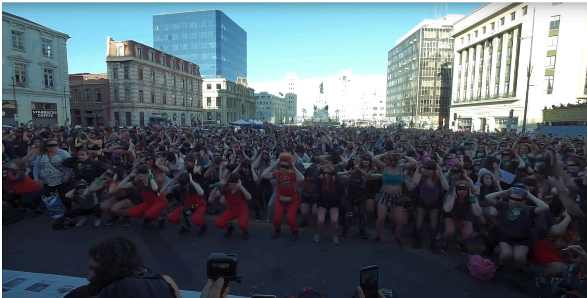
Figura 7: Un violador en tu camino , 2019. Plaza Sotomayor, Valparaíso, Chile.

Así, Un violador en tu camino , además de proporcionar un potente caso de estudio sobre las conexiones entre el arte y el feminismo latinoamericano, señala las posibilidades feministas de interlocución artística cuya actuación y engranaje no se localizan estrictamente en el ámbito institucional de los museos, abriendo surcos para tejer una historia del arte de contranarrativas incluso —y sobre todo— en medio del creciente dominio de la ultraderecha sobre los campos simbólicos. De este modo, convierte estos espacios en meros puntos del mapa, y no en el destino final de un trabajo artístico.