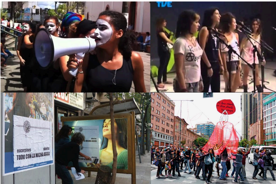
Figura 1: Arriba a la izquierda: Loucas de Pedra Lilás , intervención urbana en Palmares, Pernambuco. Fuente: Acervo do Vídeo Popular em Pernambuco, 2025. 12 Arriba a la derecha: Putinhas Aborteiras , actuación musical feminista en TVE-RS. Fuente: TVE-RS, 2014. 13 Abajo a la izquierda: Mujeres Públicas, Todo con la misma aguja. Fuente: Sitio web Mujeres Públicas, 2025. 14 Abajo a la derecha: Mujeres Creando, Espacio para abortar, procesión-performance en Bolivia. Fuente: Sitio web de la Fundación Bienal de São Paulo. 15

En Argentina, Mujeres Públicas, un colectivo creado en 2003 por artistas activistas, participa en festivales y protestas callejeras con carteles en los que se leen frases como “Escarpines y aborto: todo con la misma aguja”. Es decir, la aguja que teje los escarpines de lana para bebés es la misma que perfora úteros en abortos clandestinos.