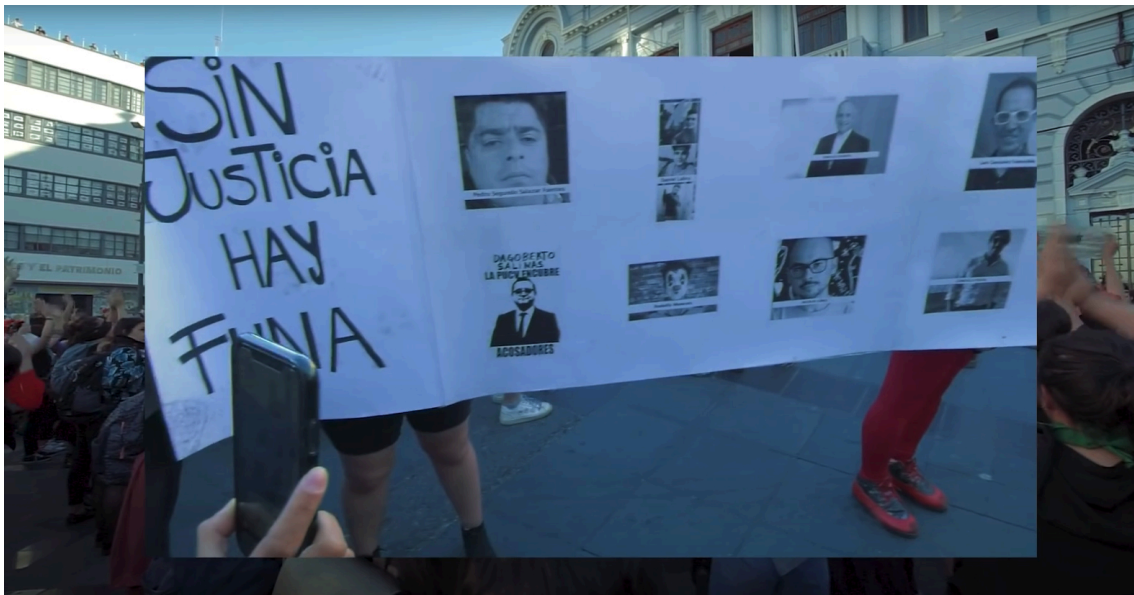
Figura 3: Un violador en tu camino , 2019. Plaza Sotomayor, Valparaíso, Chile. Frame de “LASTESIS. Plaza Sotomayor 29.11.2019. VALPARAÍSO, CHILE” – YouTube. 20

2) Aguda, intensa y perspicaz: transforma la teoría feminista (por ejemplo, Rita Segato) en activismo callejero encarnado y desobediente. Lo personal y lo social son políticos y se explicitan en el verso “El estado opresor es un macho violador”, al nombrar al Estado, al presidente, a los carabineros y a los jueces como machos violadores, tanto en el pasado como en el presente (eras/es). En ese momento, se señala el Cuartel General de la Armada de Chile, símbolo de las fuerzas armadas y de la represión estatal, y los monumentos históricos relacionados con la guerra y el nacionalismo, en el caso de la actuación en la Plaza Sotomayor, en Valparaíso, Chile.