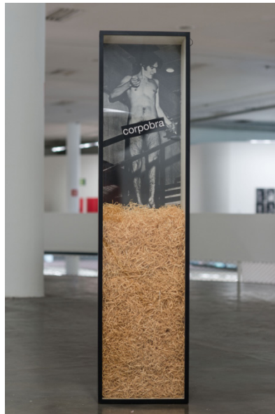
Figura 3: O Corpo é a Obra (1970), de Antonio Manuel. Uma de suas ações mais brutais, em que o artista se despiu por inteiro e apareceu na abertura do Salão Nacional de Arte Moderna de 1970 e gritou no meio da multidão: "Eu sou a própria obra de arte. É preciso que todos me apreciem". (CORREIO DA MANHÃ, 1970)