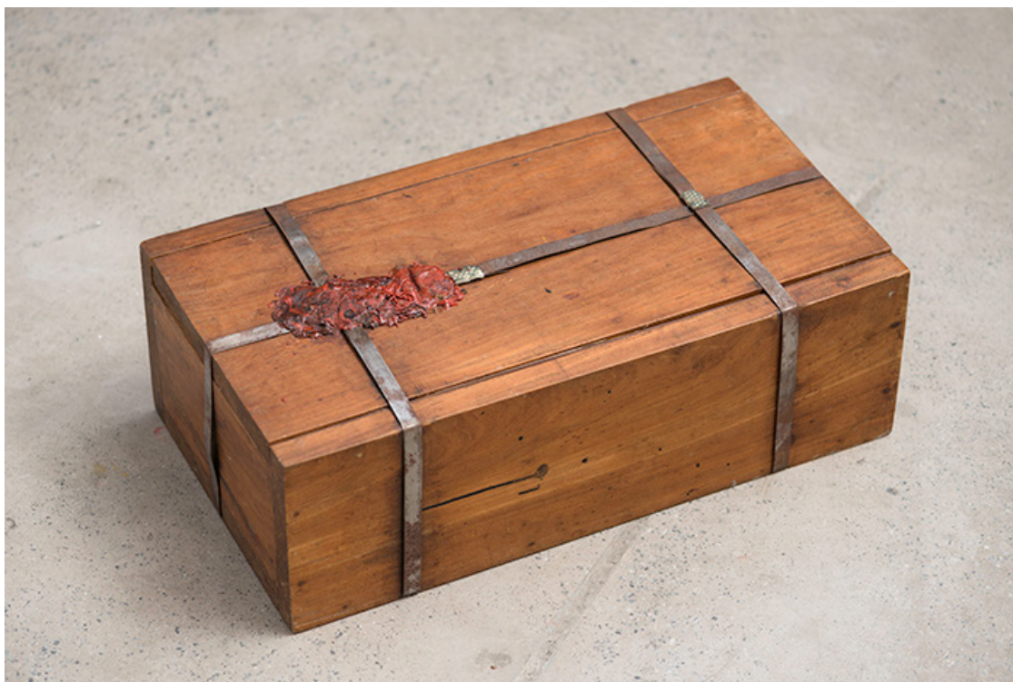
Figura 2: "Urnas Quentes" (1968), de Antonio Manuel.

Estas caixas abaixo eram a proposta artística de Antonio Manuel: as Urnas Quentes . Quentes porque urgentes, Urnas com seu duplo sentido de ou funerária ou eleitoral.