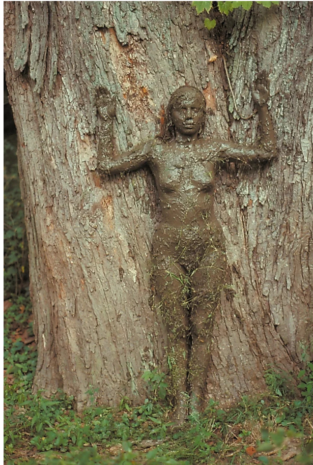
Figura 5. Árbol de la Vida, 1976, Ana Mendieta.