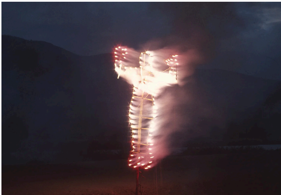
Figura 4. Anima, Silueta de Cohetes (Firework Piece), 1976, Ana Mendieta.