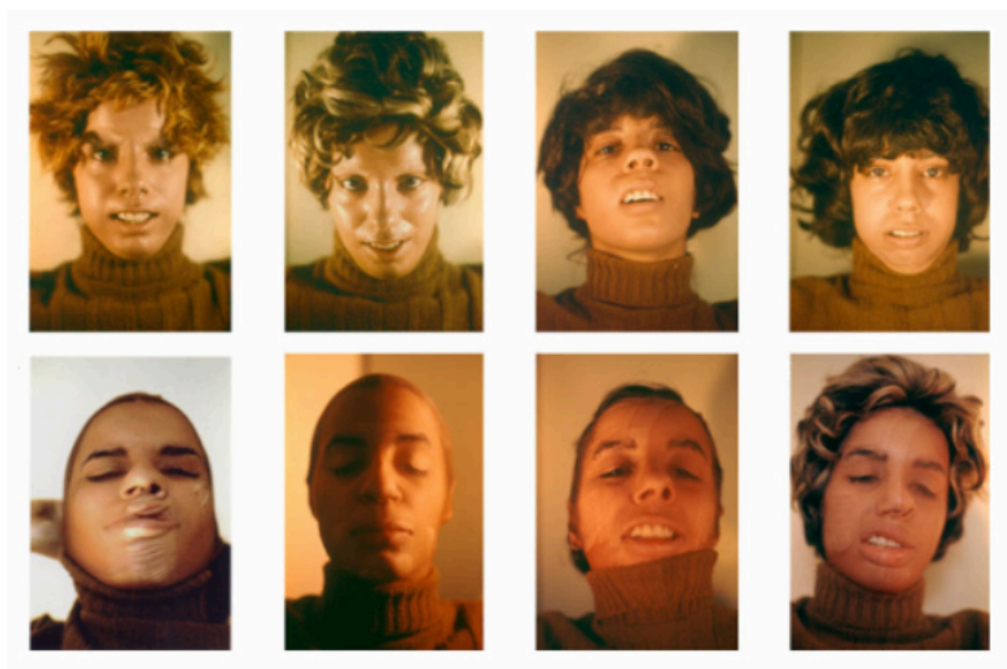
Figura 3. Untitled (Facial Cosmetic Variations) , 1972, Ana Mendieta.

A obra Untitled (Facial Cosmetic Variations) (1972) (Figura 3), também investida da linguagem das variações faciais, aponta outras questões e violências por trás da mesma expressão simbólica. A obra é constituída, assim como as anteriores, por um conjunto fotográfico que remete a um estado criado por uma ação. As oito fotografias que compõem essa performance apresentam 8 figuras distintas, todas fotografadas de frente, com aparência de uma fotografia de documento ou uma foto 3×4. Por mais que se pareçam em certo modo (por serem todas encenadas pela artista), as pessoas performadas nas fotografias apresentam variações físicas, ora pequenas, ora expressivas o suficiente para gerar incômodo. O incômodo por vezes é criado pela estranheza visual da aparência que se cria e outras propriamente pela sensação de desconforto físico causado pelas alterações faciais.