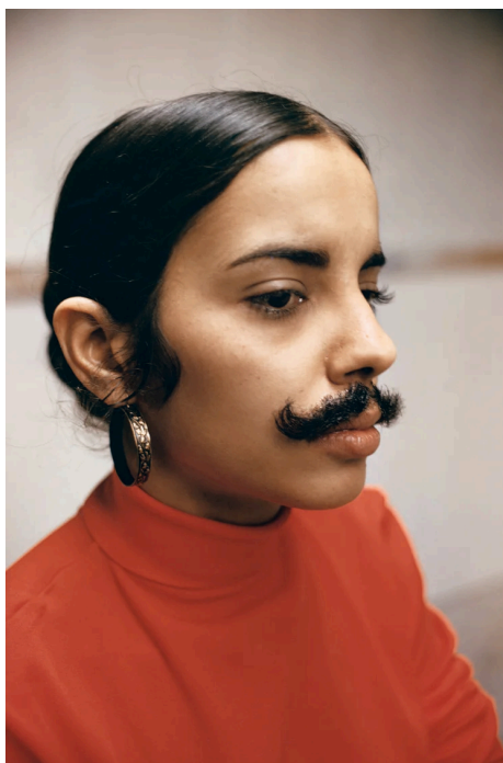
Figura 1. Untitled (Facial Hair Transplants) , 1972, Ana Mendieta.

Nesta obra, Mendieta recorre ao ininteligível para questionar a estabilidade das identidades. Como visto anteriormente, Butler (2023) aponta que as identidades são guiadas por uma matriz de inteligibilidade, matriz essa conduzida por práticas reguladoras de coerência de gênero que instauram o que é uma identidade legível. Orientadas pela heterossexualidade do desejo e pelo binarismo de gênero, identidades que ultrapassam os limites dessa matriz são vistas como ininteligíveis, desviantes.