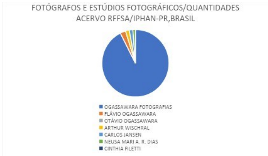
Gráfico 01: Autores/Fotógrafos e estúdios fotográficos identificados – Acervo fotográfico da extinta RFFSA/IPHAN-PR, Brasil.