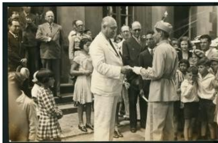
Fig. 02: Fotografia do Álbum de Motivos da Escola de Artes e Ofícios da Cooperativa dos Ferroviários, 1935.

A pesquisa inédita na realização do inventário por AUTORES (fotógrafos e fotógrafas), mostrou que, das 16.654 fotografias, não foram identificados autores em 10.512 ou sem dados, ou seja, 63,11% não foram identificados, mais da metade do acervo, demonstrando possibilidades de futuras pesquisas. Os fotógrafos ou fotógrafas identificados com maior número de autorias foram: a empresa Ogassawara Fotografias Ltda. 10 , com 5.450 fotografias, constando ainda 156 fotografias feitas por Flávio/Ogassawara Fotografias Ltda. e 02 fotos por Otávio Ogassawara, 104 fotos de autoria de Arthur Wischral 11 e 102 fotografias de autoria de Carlos Jansen. Dentre as mulheres fotógrafas, foram identificadas Neusa Mari A. R. Dias, com 72 fotos, e Cinthia Filetti, com 24 fotografias. Dentre os fotógrafos identificados pode-se destacar Arthur Wischral, importante fotógrafo do Paraná. Segue uma das 104 fotografias identificadas de autoria de Wischral.