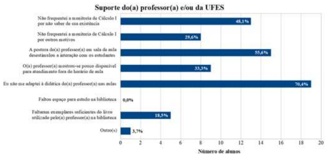
Figura 3: Fatores relativos ao suporte do(a) professor(a) e/ou da UFES.

O terceiro conjunto de fatores apontados, relativos ao suporte do(a) professor(a) e/ou da UFES, são apresentados na figura 3.