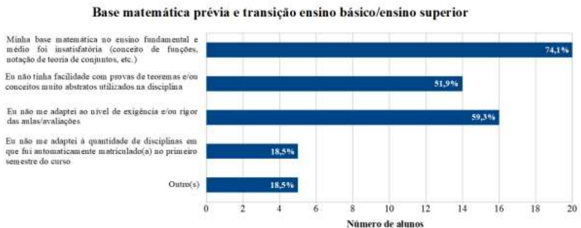
Figura 1: Fatores relativos à base matemática prévia e à transição ensino básico/ensino superior.

O primeiro deles diz respeito à base matemática com a qual os respondentes chegaram ao ensino superior. A figura 1 apresenta os resultados para esse conjunto de fatores. Ressaltamos que os respondentes poderiam selecionar mais de um item e, por isso, as porcentagens na figura 1 não precisam somar 100%. Alguns respondentes optaram por revelar alguns detalhes sobre os itens selecionados e apontaram outros fatores que julgaram relacionados à base matemática prévia e à transição ensino básico/ensino superior, como mostrado na tabela 3.