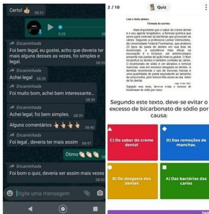
Figura 1 – Feedbacks e modelo de perguntas do quiz