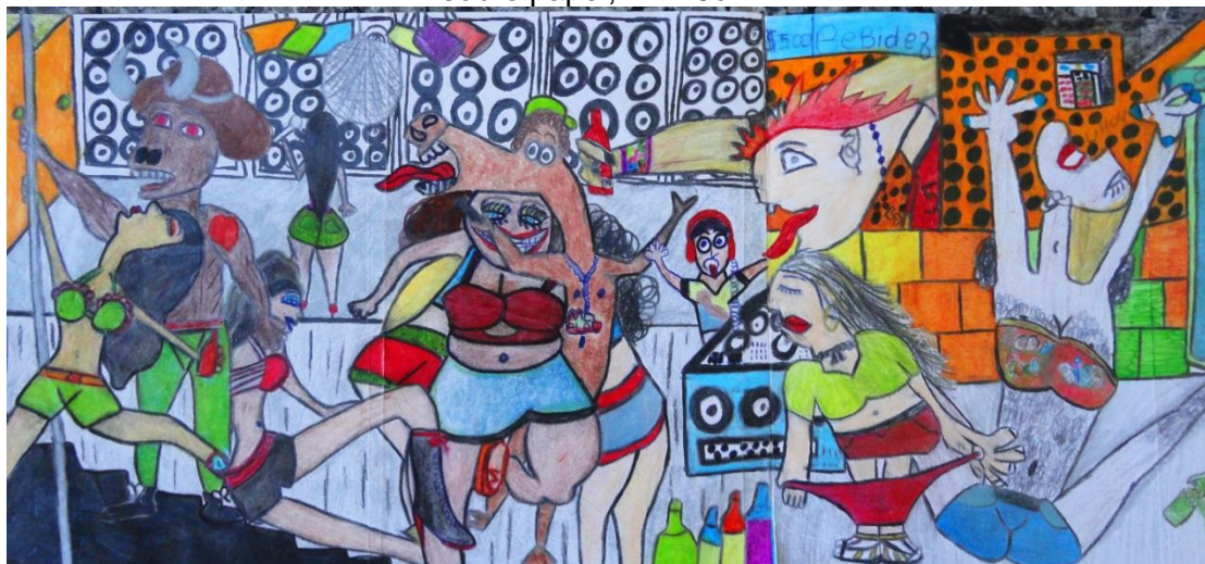
Figura 04: Releitura de Guernica , feita pelos alunos do 9º B (2011), lápis de cor sobre papel, 21x40cm.