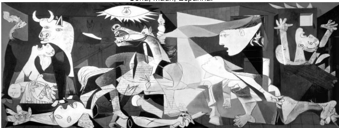
Figura 01: Guernica , de Pablo Picasso (1937), óleo sobre tela, 350x780 cm. Museo Reina Sofía, Madri, Espanha.

No início de 1937, Picasso foi encarregado de criar um mural para o pavilhão espanhol na Feira Mundial de Paris, mas não tinha escolhido um tema para a obra. Naquela época, a Espanha vivia uma grande guerra civil e, em abril de 1937, em plena luz do dia, a população da pequena cidade de Guernica, na região basca da Espanha dominada pelos[as] republicanos[as], foi devastada por bombardeiros[as] e combatentes alemães[ãs] da Legião Condor sob as ordens do general Franco. (KINDERSLEY, 2012, p. 218-219).