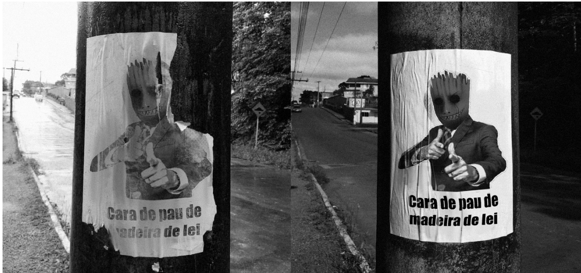
Figura 2 - Cara de pau de madeira de lei