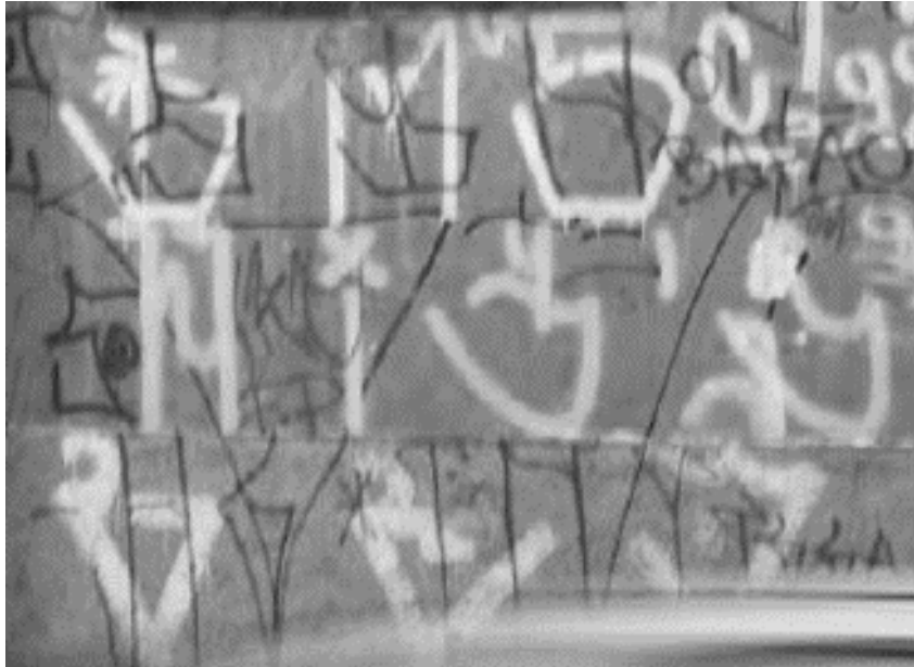
Figura 1 - Os tipos gráficos da pichação: desdobramentos visuais