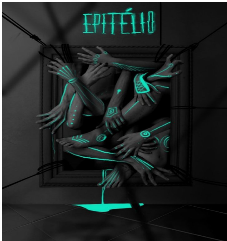
Figura 6 - Epitélio

Hoje, a pesquisa segue em construção ao prosseguir a temática a uma validação discursiva academicamente.