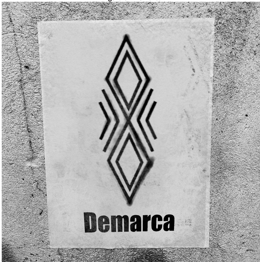
Figura 3 - Demarca