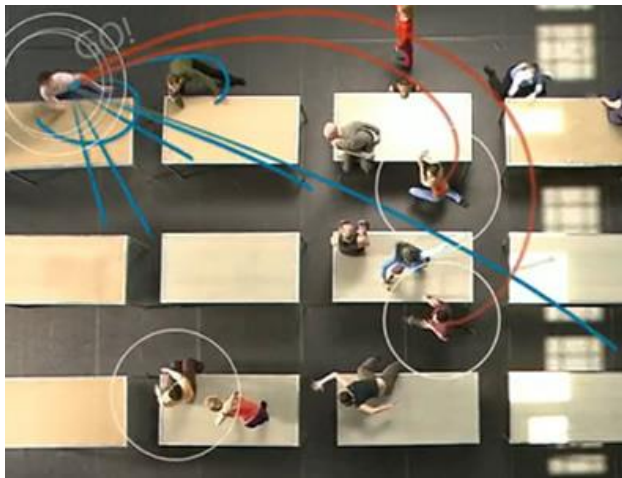
FIGURA 4 – Captura de tela das visualizações computacionais de CueAnnotations. Disponível em: < http://synchronousobjects.osu.edu/content.html#/CueAnnotations >. Acesso em: 04/10/2014.