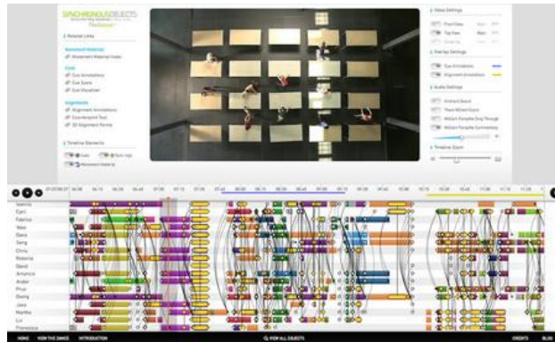
FIGURA 3 – Captura de tela das visualizações computacionais de CueAnnotations. Disponível em: < http://synchronousobjects.osu.edu/content.html#/CueAnnotations >. Acesso em: 04/10/2014.