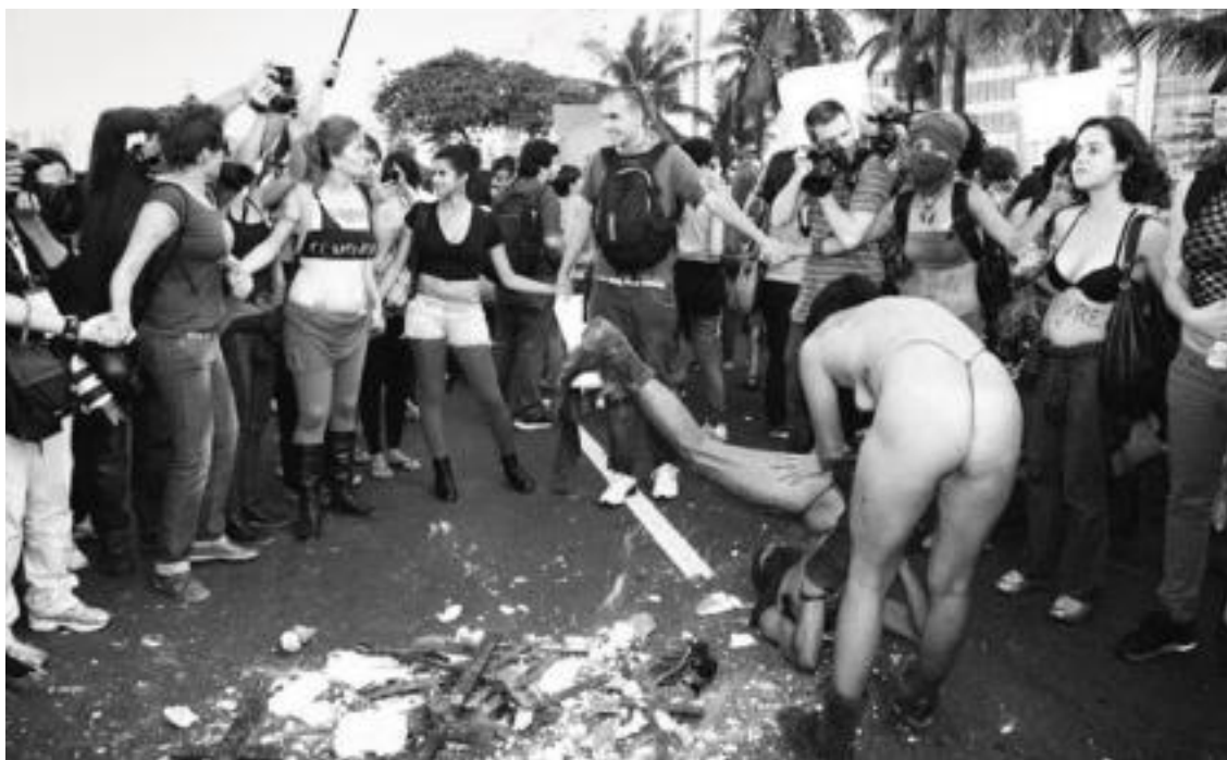
Figura 5 – Coletivo Coiote - Marcha das Vadias (2013)