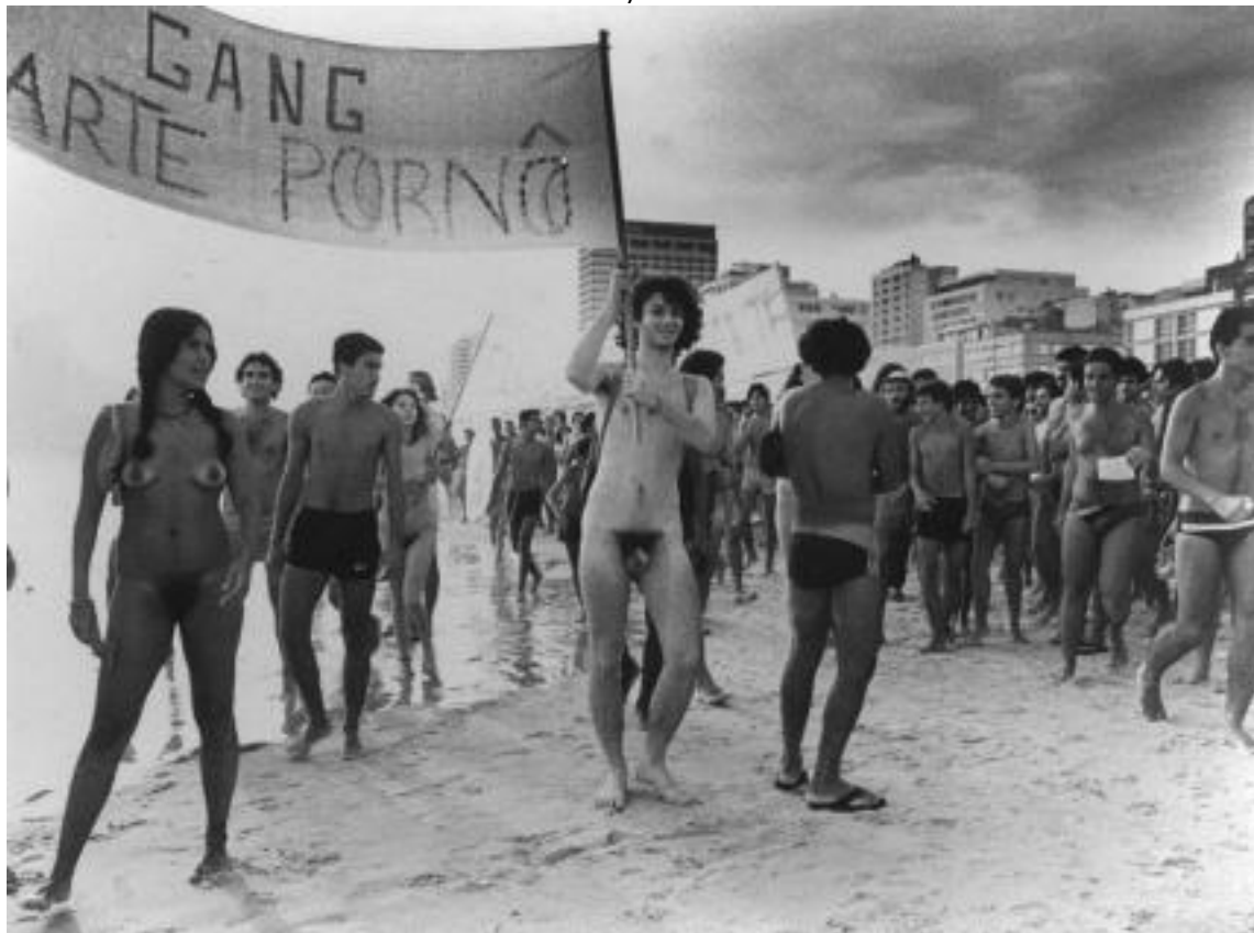
Figura 3 – Movimento de Arte Pornô (Performance Intervenção , Praia de Ipanema, 1982)

Fonte: KAC, E. Movimento de Arte Pornô (Performance Intervenção , Praia de Ipanema, 1982) DVD da performance 4'43'', preto & branco, som, vídeo. Tropicuir, 2024.