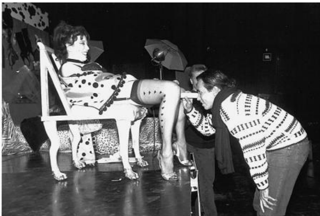
Figura 1 – Annie Sprinkle - Post-Post Porn Modernist: Public Cervix Announcement

Por insatisfação com as condições da indústria pornô, na qual trabalhava como atriz, a trabalhadora sexual e artista Annie Sprinkle inicia o movimento pós-pornô em 1990, nos Estados Unidos, ao se insurgir contra os modos dominantes e o machismo da indústria pornográfica (Preciado, 2018, p. 288). Sprinkle realiza a performance Post-Post Porn Modernist: Public Cervix Announcement (Figura 1) em uma casa noturna vestindo lingerie e salto alto, inclinada sobre uma cadeira. A artista abriu as pernas e inseriu um espêculo na vagina, convidando os espectadores a conhecê-la internamente. Com essa ação, Sprinkle realiza uma crítica à representação subalternizada do corpo e do sexo, contrapondo a medicina e indústria pornográfica. Na performance, a artista fricciona sexualidade, arte e política. Ao abrir as pernas, Sprinkle abre as portas para o movimento que conhecemos enquanto pós-pornô.