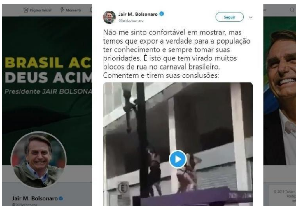
Figura 7 – Tuíte de Jair Bolsonaro em 5/3/2019