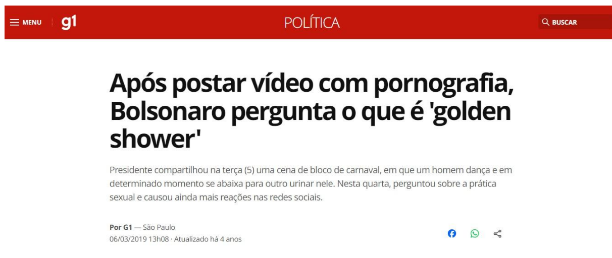
Figura 8 – Matéria no portal G1 (2019)