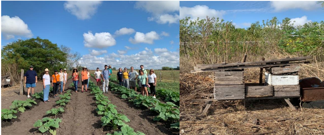
Imágenes 1 y 2. Visita a la huerta del productor familiar, y colmenas que testimonian el pasado de su familia vinculado a la actividad apícola

Consultado al respecto de la actividad apícola, el productor incluyó una explicación sobre la historia de su familia, estrechamente relacionada con la apicultura. Su padre había introducido la apicultura en la zona hacía más de 60 años, actividad que ya había aprendido en la provincia de Buenos Aires, desde donde había migrado con su esposa. Todos sus hijos nacieron en Larroque, pero solo uno sostuvo la actividad productiva hasta el presente. El productor se lamentaba debido a que ninguno de sus hijos manifestaba interés en sostener la huerta pese a todo el trabajo que había podido sostener su familia en el pasado gracias a ese campo.