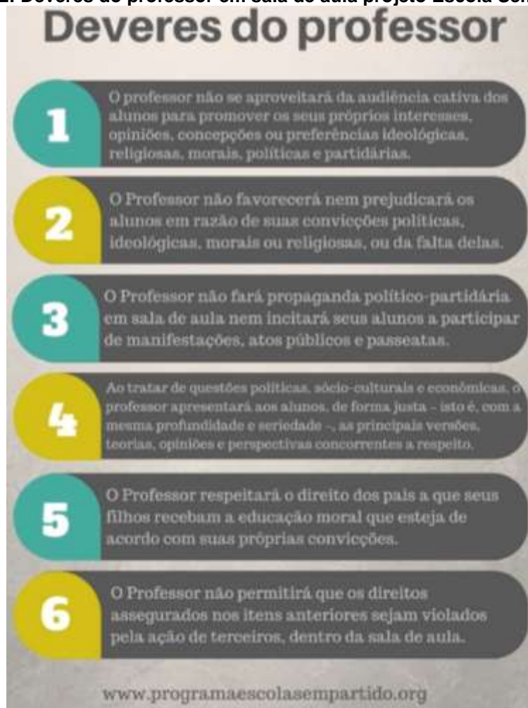
Figura 2: Deveres do professor em sala de aula projeto Escola Sem Partido

professores doutrinadores que fazem com que o aluno questione valores de sua família, questione inclusive a sua sexualidade. O PL 687 de 2015 apresenta um cartaz que propõe que sejam fixadas nas salas de aulas de todo o país contendo os deveres do professor,