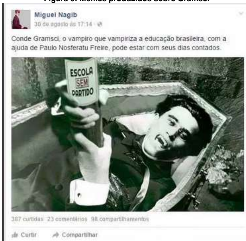
Figura 3: Memes produzidos sobre Gramsci