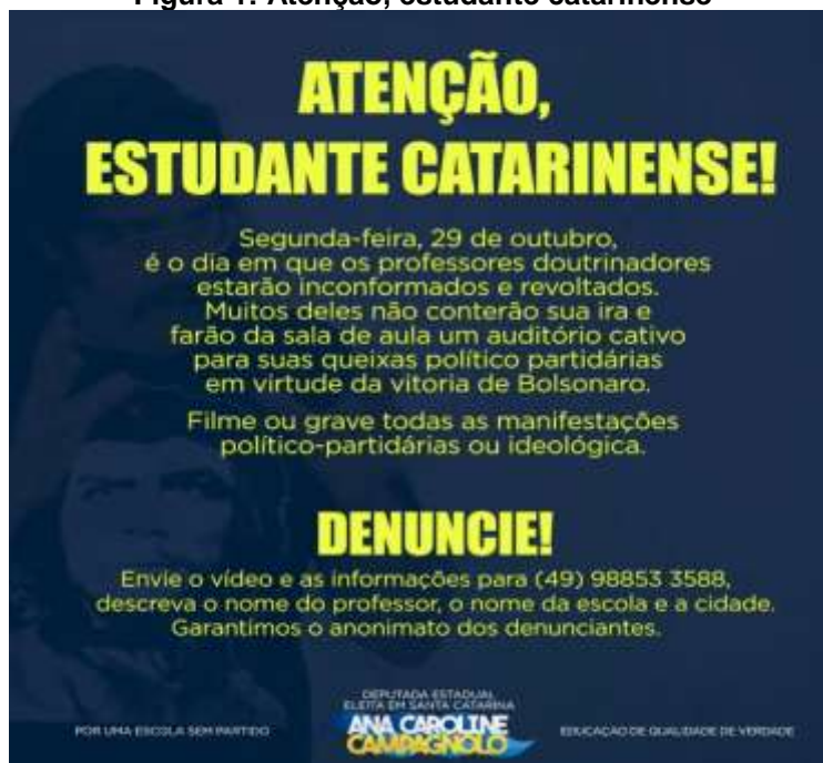
Figura 1: Atenção, estudante catarinense