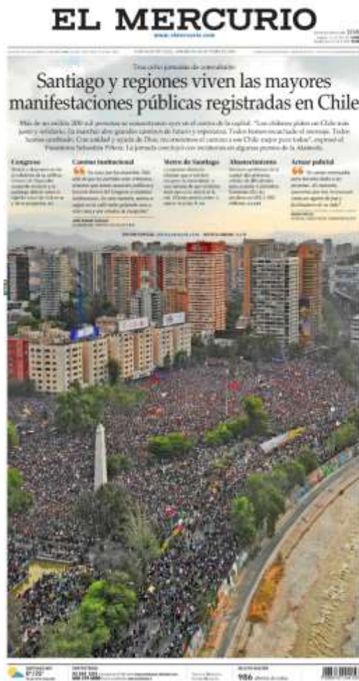
Figuras 1 y 2: A la izquierda, portada de “El Mercurio”; a la derecha, portada de “La Tercera”. Ambas son las correspondientes portadas del día 26/10/2019