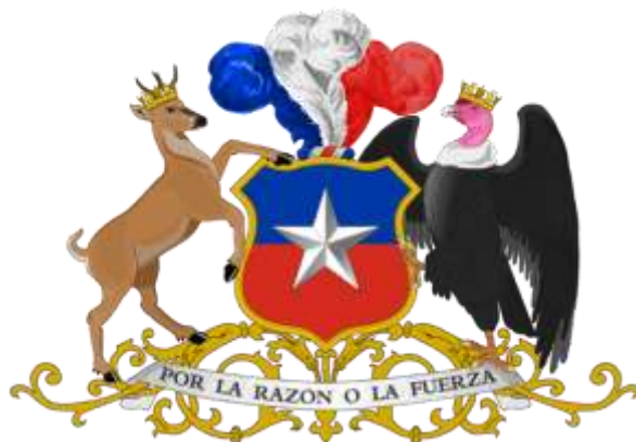
Figura 5: Escudo Nacional de Chile

El último texto complementario de “El Mercurio” es la palabra que representa el orden, son del general Director de Carabineros. La posición del texto es estratégica: si se empieza con el discurso-apelo del mandatario máximo, se termina con el discurso de las fuerzas de orden, y entre el primero y el último, figuran las razones por las que es necesario hacer la Unidad a la que llama el presidente. Como dice el lema del escudo nacional de Chile, “POR LA RAZÓN O LA FUERZA”: