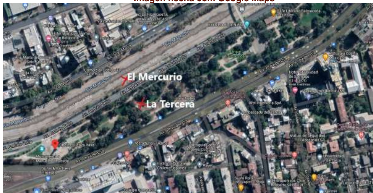
Figura 3: Estimativa de los locales desde donde se tomaron las fotografías. Imagen hecha con Google Maps

y en “La Tercera” todo el lado derecho. Si se considera la posición del obelisco en relación al río, la posición desde la que cada uno de los periódicos obtuvo su fotografía podría ser como sigue: