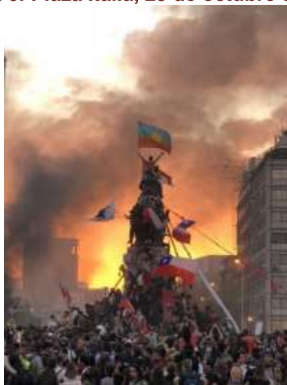
Figura 6: Plaza Italia, 25 de octubre de 2019

Intentamos mostrar en el apartado anterior cómo los periódicos más tradicionales de Chile construyen el mito, lo que era el objetivo de nuestro artículo. No queremos terminar, todavía, sin hablar de una imagen que no estuvo presente y ningún gran medio noticioso chileno, impreso o digital, ni el día 25, ni el día 26 de octubre 5 . Es importante considerar la imagen que no estuvo, porque su ausencia tiene significado. El contenido y forma de esa fotografía, cuando comparados con las de los periódicos, componen un contraste de fuerte sentido. La imagen a que nos referimos es la que sigue: