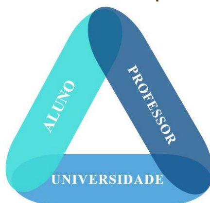
Imagem 3: Tríade educacional: aluno-professor-universidade