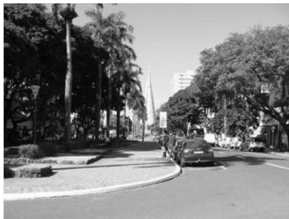
Figura 13. Espaço Intangível e Perspectiva Delimitada

As palmeiras reais, plantadas com um rigor de distanciamento, passam a sensação de Espaço Intangível , graças à sucessão de árvores. Somado a isso, o transeunte é induzido a contemplar a edificação no fim do eixo, a Catedral, caracterizando uma Perspectiva Delimitada .