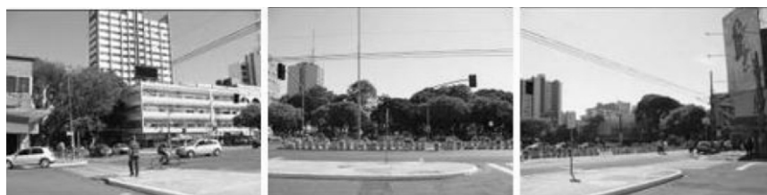
Figura 9. Campo Visual 7- Esquerdo, Frontal e Direito