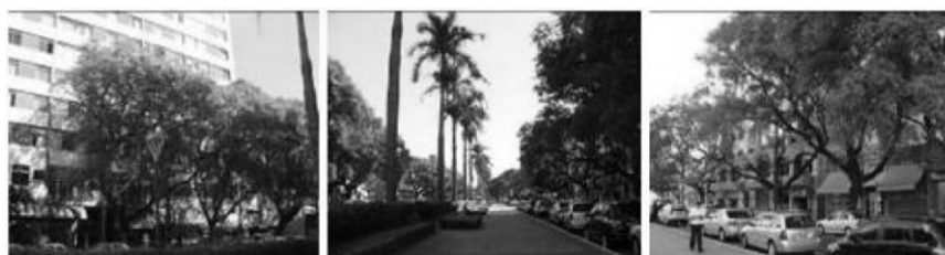
Figura 4. Campo Visual 2- Esquerdo, Frontal e Direito