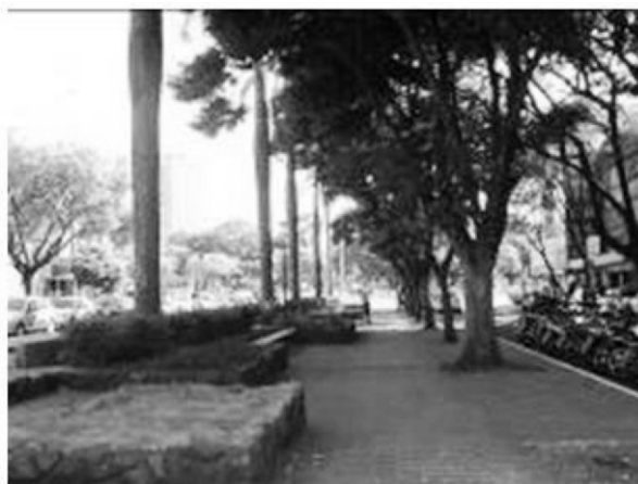
Figura 12. Expectativa

No campo visual 6, cria-se Expectativa , pois estando sob a cobertura das árvores, é instigada uma curiosidade, devido ao mistério causado.