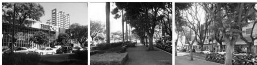
Figura 8. Campo Visual 6- Esquerdo, Frontal e Direito