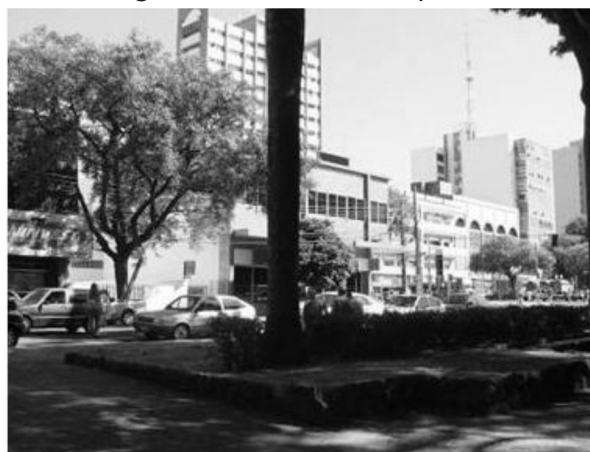
Figura 11. Território Ocupado

Similarmente, ocorre o efeito de Território Ocupado , haja vista que a sombra oferecida pelas copas das árvores e os bancos instalados nas calçadas proporcionam um ambiente para uma ocupação estática, porém, não monótona. Mas também ocorre Apropriação pelo Movimento , devido ao intenso fluxo de pessoas no horário comercial, em que essas se apropriam do espaço exterior.