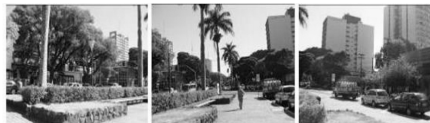
Figura 6. Campo Visual 4- Esquerdo, Frontal e Direito