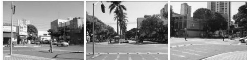
Figura 5. Campo Visual 3- Esquerdo, Frontal e Direito