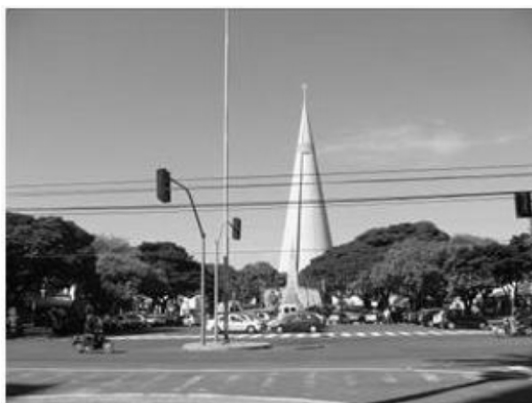
Figura 14. Ponto Focal, Silhueta, Focalização, Metáfora e Omissão Significativa

Quanto às fachadas das edificações que compõem o Eixo Monumental, predomina a Rudeza e Vigor , graças à rigidez nas linhas construtivas. Em contrapartida, a forma da Catedral sugere uma Metáfora , fazendo uma analogia com foguete e seu destaque em relação ao monumento no centro da Praça de Convivência gera uma Omissão Significativa deste último.