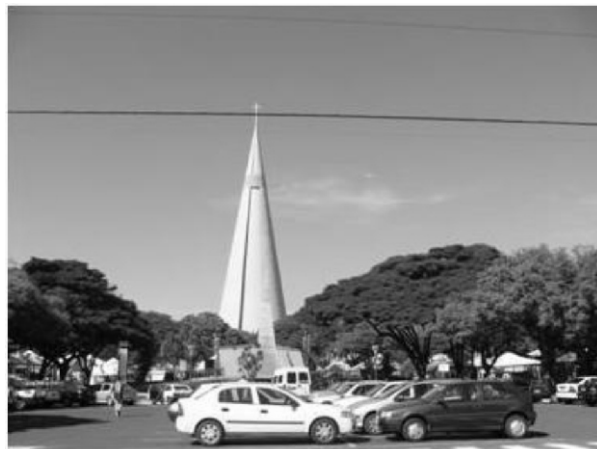
Figura 10. Apropriação do Espaço

sensações causadas nos transeuntes, o primeiro fenômeno a ser destacado é Apropriação do Espaço , em que o calçadão localizado em uma das extremidades da via é usado para fins comerciais, principalmente em determinadas épocas do ano, quando é realizada Festas Típicas.