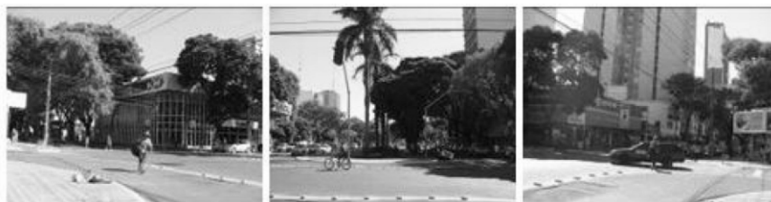
Figura 7. Campo Visual 5- Esquerdo, Frontal e Direito