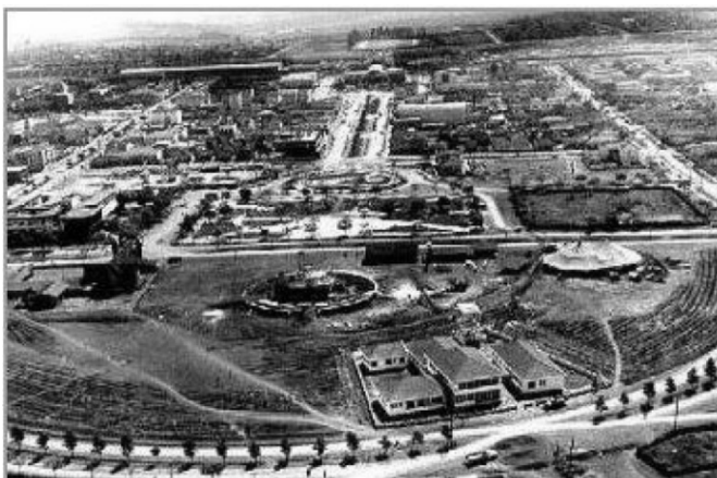
Figura 1. Período da construção da cidade