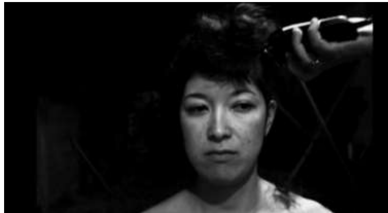
Imagens do vídeo “Será que eu corto meu cabelo”

a personagem raspa o cabelo. Imagens em preto e branco com som autoral a partir de livre utilização de outras músicas.