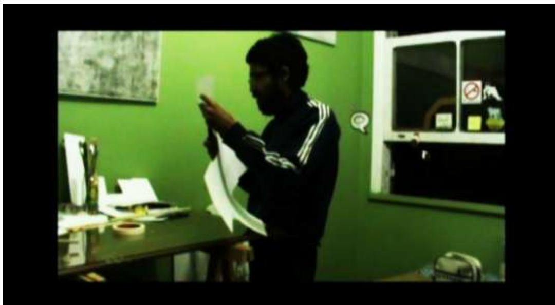
Imagens do vídeo “Um Dia”

Para a conclusão deste curso Técnico em Audiovisual, é realizada por parte dos estudantes uma produção de um curta metragem onde é esperado um trabalho mais elaborado e atento aos processos do trabalho em cinema.