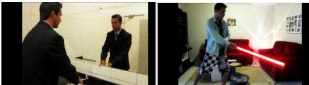
Imagens do vídeo realizado pelos estudantes “Curta”

A primeira proposta, os participantes escolheram um objeto link comum a todas as produções, que também teriam que pensar temas sobre trivialidades da vida. Como caminhos cotidianos: trajetos de casa para o trabalho; ações ou escolhas simples: comportamentos individual e social. Daí surgiram produções como “Curta” e “Carillon à Musique” onde os personagens tem um comportamento específico socialmente e quando sai do trabalho e chega em sua casa pode relaxar;