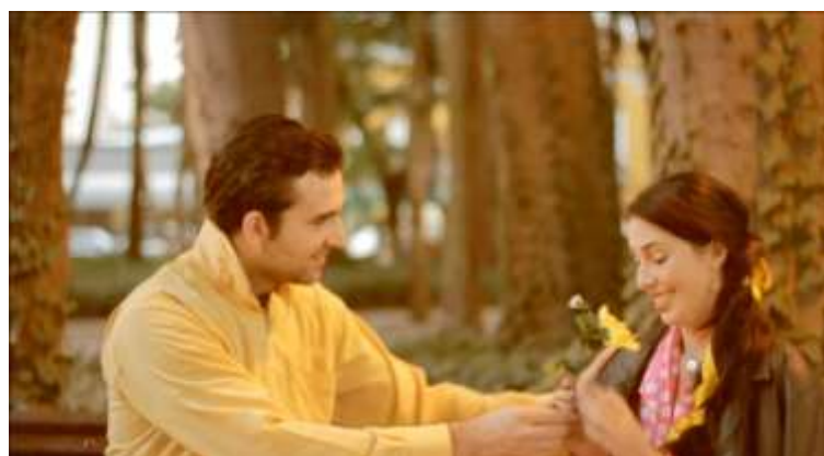
Imagens do vídeo dos estudantes “Fita amarela”

A segunda proposta partiu do conhecimento relativo ao equipamento de captação de vídeo, onde foi pensado os filtros de lente, escolhas de branco, isso relacionado a direção de arte na produção do cenário, locação, objetos de cena, maquiagem, planos e a articulação destes na montagem. Para a produção foi, ainda, proposto a escolha de uma cor predominante tanto na direção de arte quanto na fotografia. Desta etapa pode ser citado o trabalho dos alunos “ Fita amarela ” em que eles criaram um vídeo para a música de mesmo nome interpretada por Clara Nunes, onde apresentam um casal a namorar, brigar e voltar a namorar. Todo elaborado imageticamente com realce da cor amarela; e o “ Minha a Barba ” com a predominância da cor azul e uma montagem de planos rígidos em uma locação interna.