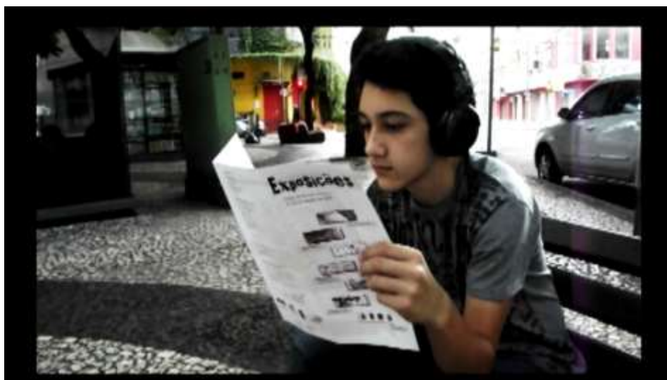
Imagens do vídeo dos estudantes “Panóptico”

A terceira proposta veio ao perceber a dificuldade na representação da passagem do tempo e na articulação entre planos abertos e gerais com planos mais fechados e detalhes. Desta proposta desdobraram o vídeo “Panóptico” onde relaciona cenas e sons urbanos, com cortes rápidos em contraponto a uma música de Yann Tiersen quando o personagem se acalma e contempla sobre a vida nos centros urbanos;