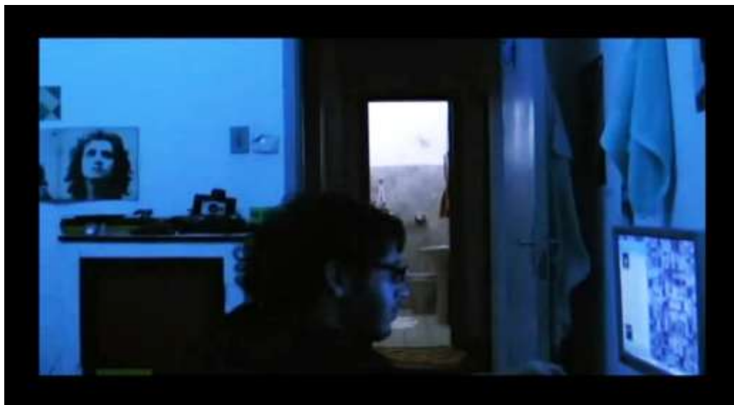
Imagens do vídeo “Minha a barba”

A terceira proposta veio ao perceber a dificuldade na representação da passagem do tempo e na articulação entre planos abertos e gerais com planos mais fechados e detalhes. Desta proposta desdobraram o vídeo “Panóptico” onde relaciona cenas e sons urbanos, com cortes rápidos em contraponto a uma música de Yann Tiersen quando o personagem se acalma e contempla sobre a vida nos centros urbanos;