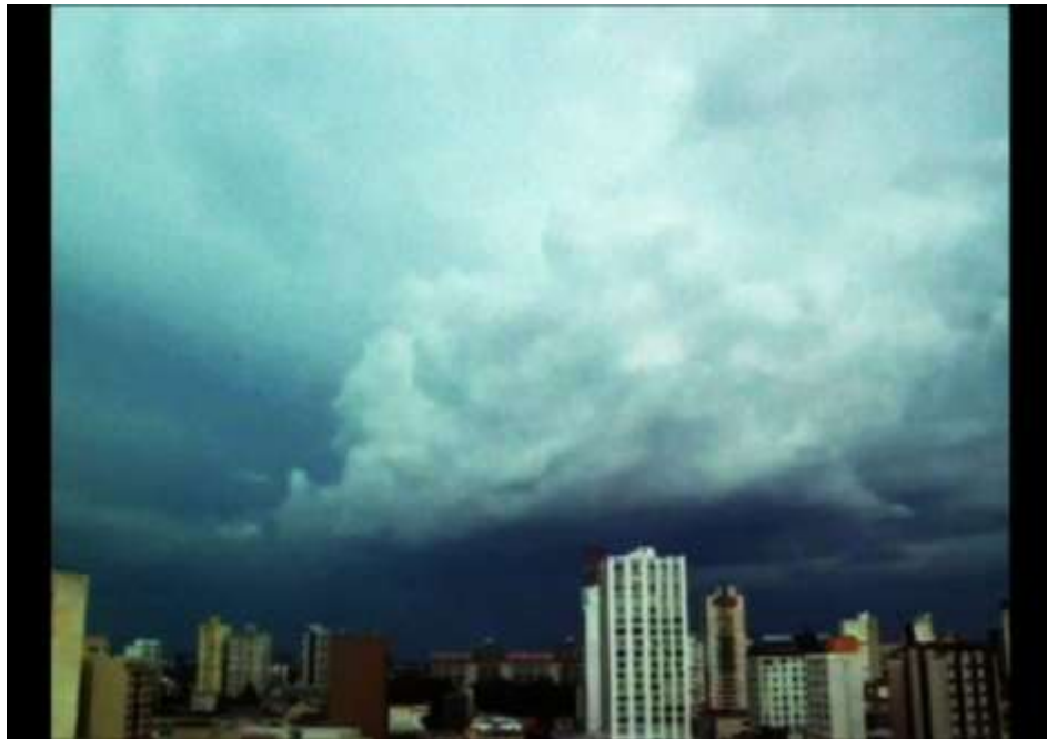
Imagens do vídeo “tempo médio”

apresenta o dia de um artista a trabalhar em seu atelier enquanto passa o tempo e isso é percebido através de imagens urbanas e de pessoas em seu cotidiano.