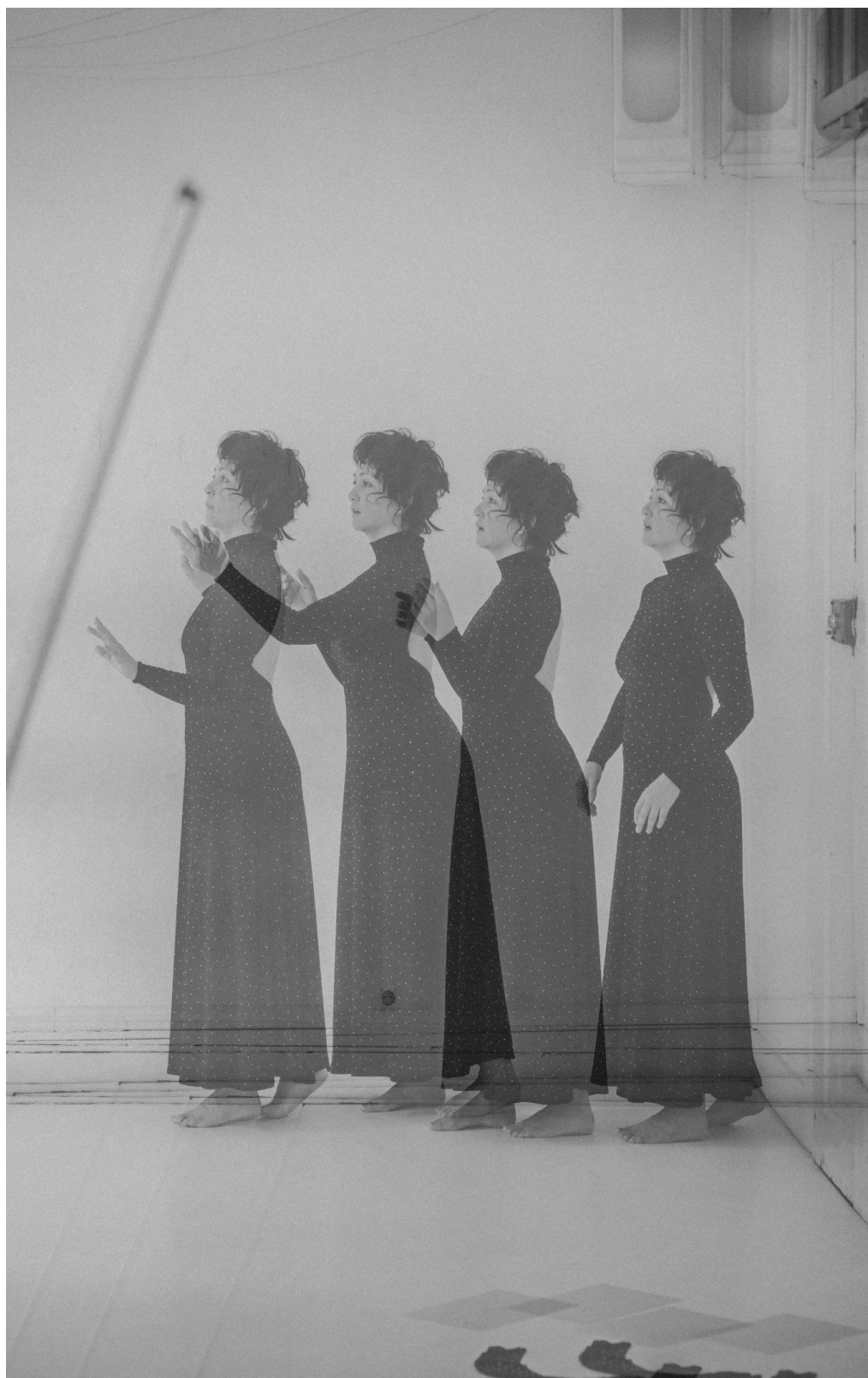
Figura 2 - o.movimento.do.som