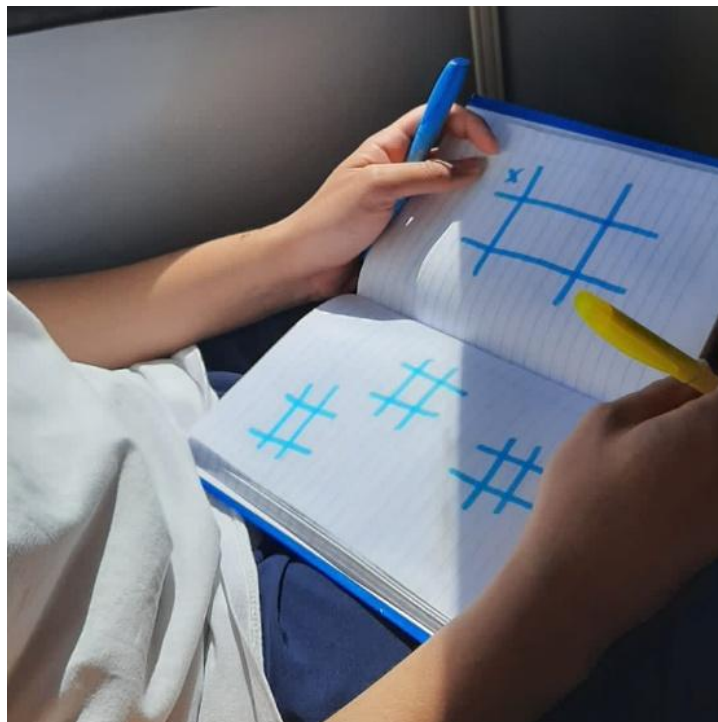
Figura 1 – Jogo-da-velha

A terceira vivência, realizada no dia 17 de maio de 2023, já contava com um programa performativo relacional, contudo, o elemento das confidências ainda não integrava o programa. Nesse dia, uma das grandes dificuldades enfrentadas foi a lotação do ônibus: a ação foi realizada em horário próximo às 13h e o ônibus estava com uma grande quantidade de passageiros, dificultando a possibilidade de o pesquisador sentar-se ao lado de alguém. Quando finalmente foi possível convidar alguém a jogar as partidas de jogo-da-velha e jogo-da-forca, a pessoa convidada teve uma atitude inesperada: durante o jogo começou a compartilhar aspectos da sua vida pessoal com o pesquisador.