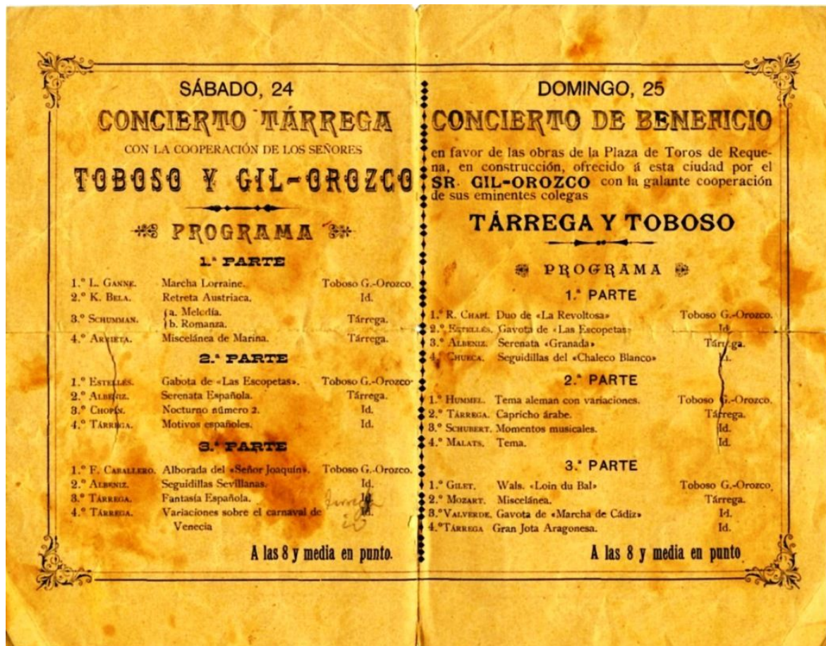
FIGURA 2 – Programa dos concertos realizados na pequena cidade de Requena, por Tárrega, Toboso e Gil-Orozco, em 1900.