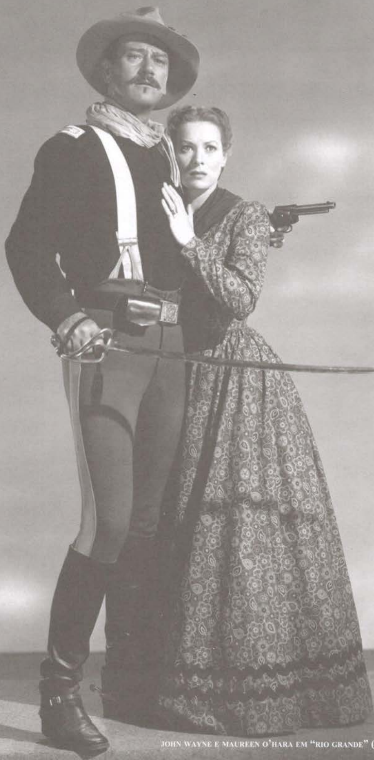
JOHN WAYNE E MAUREEN O'HARA EM "RIO GRANDE" (1950)