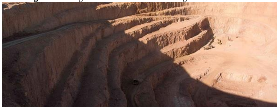
Figura 2 - Fotografía de Yacimiento Cerro Vanguardia a cielo abierto.

Actualmente, 9 empresas extraen o extrajeron minerales metalíferos (sólo una terminó la producción en 2012) llevan obtenidas –según información oficial- más de 9.500.000 de onzas de oro. Esas empresas, radicadas en diferentes ciudades ubicadas en la MCS o próximas a ella, han provocado la movilización de contingentes poblacionales en busca de nuevas, más y mejores oportunidades laborales, cuya magnitud es apreciable en la comparación de CNP como así también en diversos relevamientos que por su propia cuenta han asumido diversos municipios de la región. En el caso de Puerto San Julián, las comparaciones intercensales dan cuenta del crecimiento, pasando de poco más de 5.000 habitantes en 1991 a más de 6.200 en 2001 y el CNP 2010 arrojó que habitaban en la ciudad 9.200 personas. Las estimaciones más recientes ubican la población en alrededor de 17 mil.