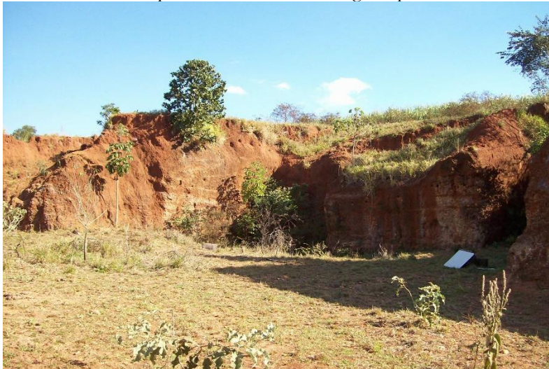
Figura 4 - Povoado Garimpo do Bandeira: área do garimpo de diamantes desativado