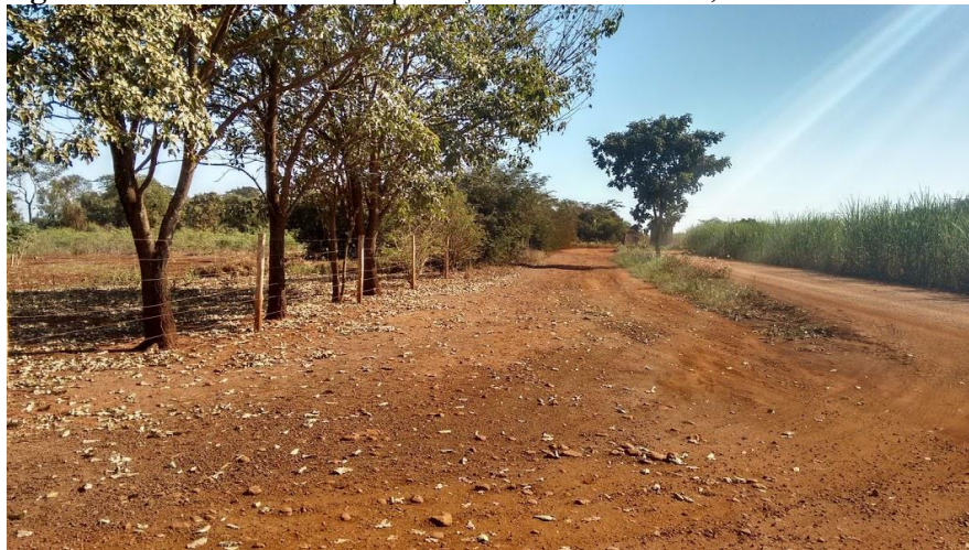
Figura 3 - Povoado da Boa Esperança: a cerca da escola, a estrada e o canavial