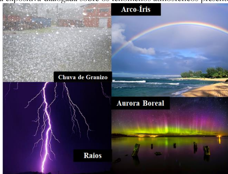
Figura 4 – Aula expositiva-dialogada sobre os fenômenos atmosféricos presentes na Troposfera.