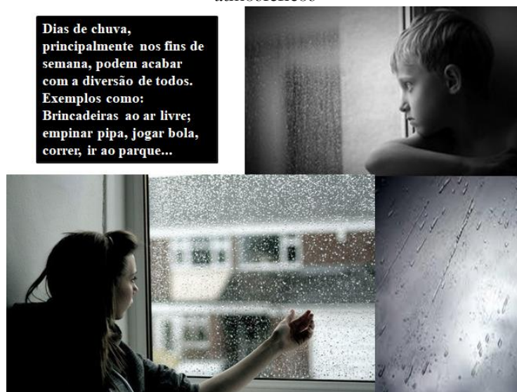
Figura 3 – Aula expositiva-dialogada sobre precipitações: as sensações a partir dos fenômenos atmosféricos