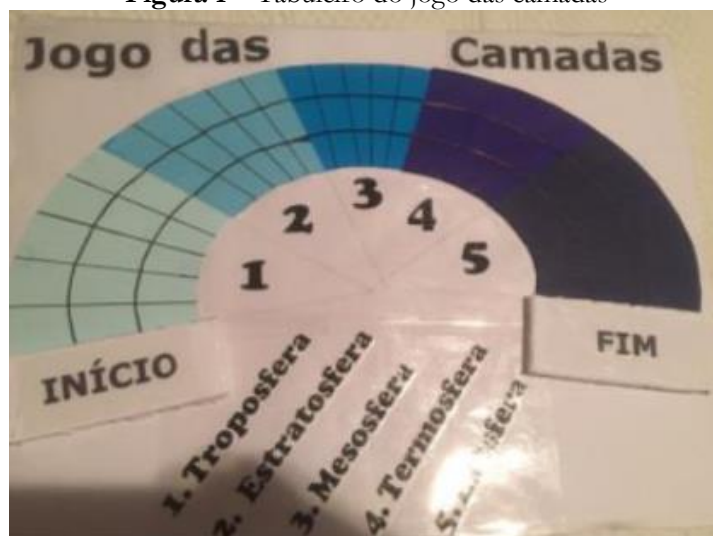
Figura 1 – Tabuleiro do jogo das camadas

O jogo das camadas atmosféricas foi desenvolvido durante a disciplina de Instrumentação para o Ensino de Geografia 2 , no ano de 2016. Dessa forma, foi elaborado o layout do tabuleiro (Figura 1), as regras e os demais componentes (cartas e pinos). O jogo realiza questionamentos sobre cada uma das camadas atmosféricas (Troposfera, Estratosfera, Mesosfera, Termosfera e Exosfera). O participante vencedor será aquele que responder mais perguntas corretamente.