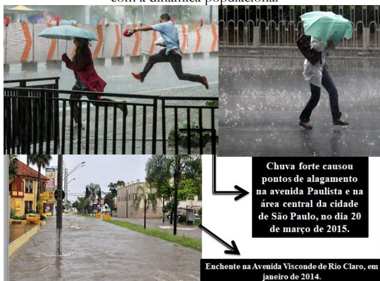
Figura 2 – Aula expositiva-dialogada sobre atmosfera: a inter-relação de fenômenos atmosféricos com a dinâmica populacional