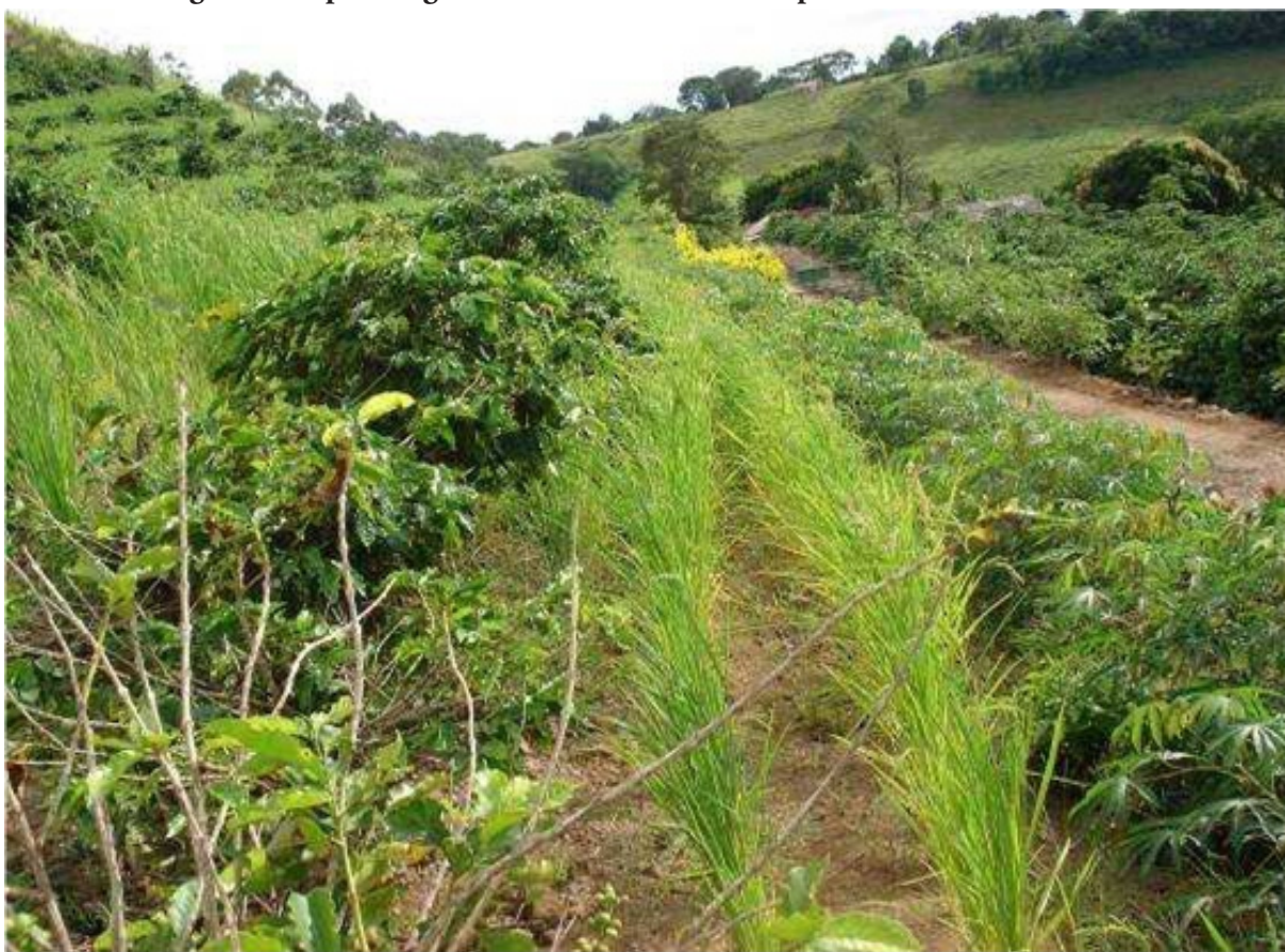
Figura 3 - Espécies agrícolas associadas no município de Corumbataí do Sul.

Já nas propriedades de produção com fluxo comercial e otimização da mão de obra familiar no cultivo de espécies consorciadas, pode-se observar na figura 3 a associação de culturas de mandioca, café, arroz, milho e como nova fonte de exploração madeireira eucaliptos ( Eucalyptus globulus ) (MASSOQUIM, LIBERALI, 2011).