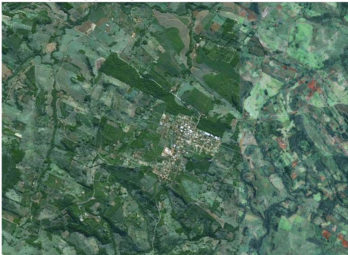
Figura 1: As pequenas Propriedades, relevo dissecado e os fragmentos florestais