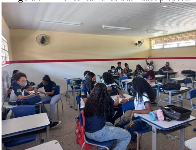
Figura 02 – Alunos realizando a atividade proposta