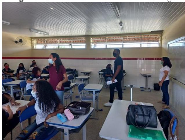
Figura 01 – Aula sobre o tema Consciência Negra