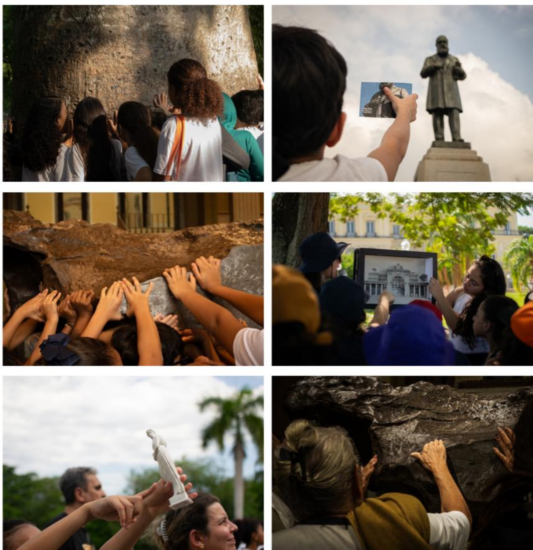
Figuras 03 a 08: Atividades Educativas - Projeto 'A Quinta como Museu'. 2025.

O estímulo a esse engajamento ativo e à curiosidade do público encontrou terreno fértil nas ações voltadas aos visitantes espontâneos. Se, em um primeiro momento, a mediação ocorria com o suporte de materiais tangíveis que costuravam a experiência do visitante à narrativa do parque de forma pontual, buscou-se articular alternativas para aprofundar essa conexão.