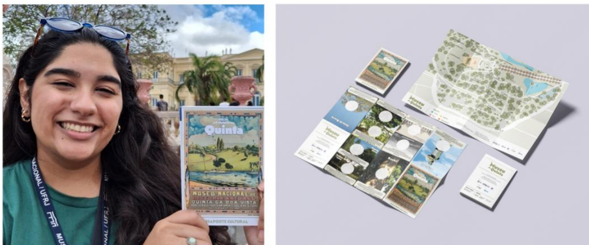
Figuras 09 e 10: Passaporte Cultural: “Volta ao Mundo na Quinta”. 2025.