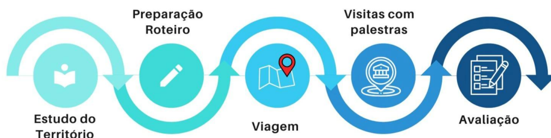
Figura 1 – Representação esquemática das fases de realização das Jornadas de Conhecimento promovidas pelo projeto “De Museu para Museu: intercâmbio, divulgação e utilização de espaços não formais de educação”.

A organização do roteiro envolve o estudo detalhado de cada ambiente a ser visitado. Sua estrutura, localização, exigências, mas também suas exposições, abordagem, história, arquitetura e paisagismo. O roteiro envolve ainda a análise logística de deslocamento, tempo de visitação, reserva de ações de mediação, contratação de mediadores, pesquisadores ou professores que complementam as informações quando necessário. A organização detalhada do roteiro já inclui também a previsão de palestras, falas, exposição de filmes e textos de apoio conforme a temática a ser abordada em cada espaço. Portanto, a elaboração do roteiro tem intencionalidade pedagógica ao pensar cada etapa da viagem com visitas e palestras com a finalidade de levar a reflexões e experiências relacionadas ao tema geral da Jornada Pedagógica. A elaboração dos roteiros envolve normalmente muitos meses de preparação e intensa pesquisa sobre o território a ser visitado.